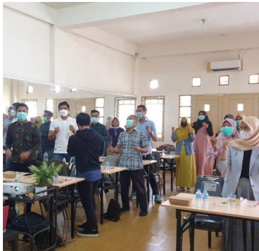
Gambar 4. 9 Praktek Public speaking

Implementasi atau pelaksanaan strategi yang dijalankan oleh Trainer mengikuti perencanaan yang telah ditentukan. Seperti, mengidentifikasi sasaran, penyusunan pesan, memutuskan metode yang tepat, dan pemilihan media. Dalam menerapkan strategi, Trainer akan mengikuti kurikulum yang sudah ditetapkan oleh AS Academy By Raisanty sesuai kebutuhan peserta.