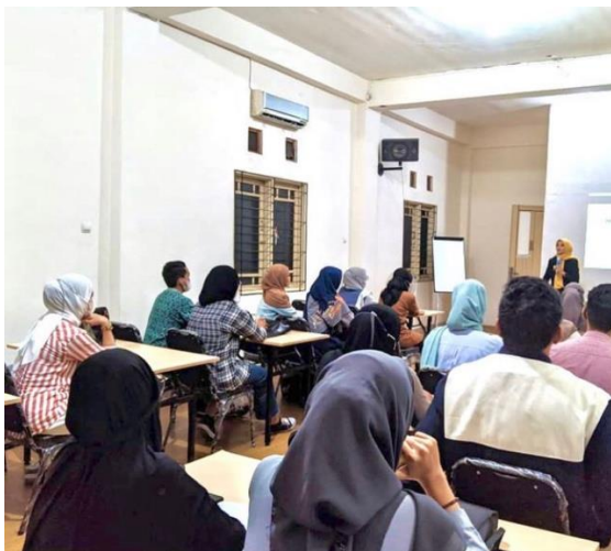
Gambar 4. 6 Kegiatan Pembelajaran Bersama Mentor

Mengenai strategi pembelajaran yang Trainer berikan, para peserta perlu menumbuhkan kepercayaan diri mereka agar lebih percaya diri untuk berbicara di depan umum. Menurut penjelasan Trainer , beliau memberikan motivasi kepada mereka agar lebih semangat. Untuk bisa semakin percaya diri, peserta harus terus berlatih sampai bisa. Agar hasilnya maksimal, Trainer memberikan pelatihan dengan pertemuan 4 kali dan para peserta sudah keliatan hasilnya. Mereka semakin berani dan percaya diri, karena kunci menjadi seorang public speaker adalah percaya diri. 66