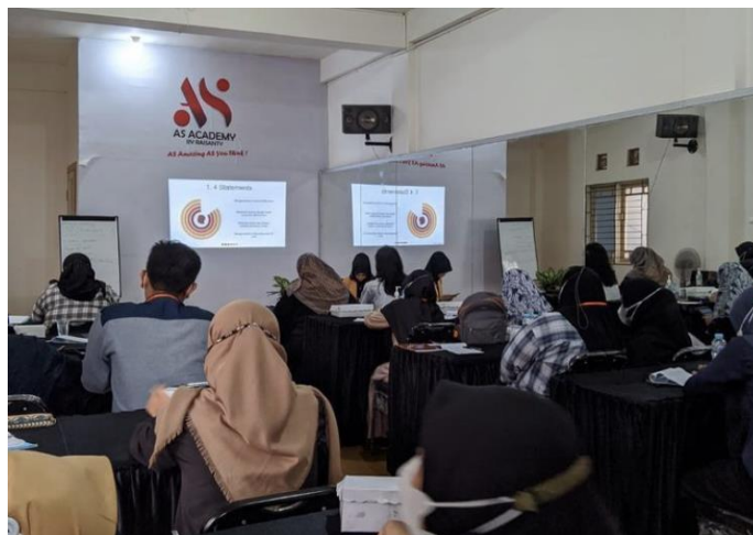
Gambar 4. 4 Kelas Offline

Setelah peserta berkonsultasi dan mengkonfirmasi mengenai tema pelatihan public speaking seperti apa yang dibutuhkan, peserta dapat memilih kelas secara offline atau online . Untuk Trainer sendiri sebenarnya lebih menyarankan untuk mengikuti kelas offline karena pelatihan dapat berjalan secara efektif dan lebih maksimal. Namun kembali lagi ke peserta ingin mengikuti kelas apa sesuai kebutuhannya sendiri. Peneliti memfokuskan penelitian pelatihan public speaking kelas privat dan kelas exclusive privat .