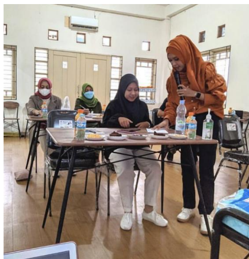
Gambar 4. 8 Kegiatan Mentoring

Peran Trainer sangatlah penting dalam proses pelatihan public speaking untuk meningkatkan kepercayaan diri peserta nya, karena para peserta akan terus di bimbing dalam proses pelatihan public speaking yang mereka jalani selama 4 kali pertemuan di AS Academy By Raisanty . Peran Trainer disini adalah menumbuhkan dan meningkatkan rasa kepercayaan diri peserta agar bisa berani tampil percaya diri di depan umum. Strategi komunikasi yang diterapkan Trainer sangat penting dan mempengaruhi peserta untuk mencapai hasil dan menyiapkan untuk jenjang karir mereka atau melakukan kegiatan sehari-hari.