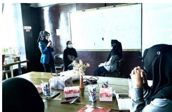
Gambar 4. 10 Praktek Bersama Trainer

Implementasi atau pelaksanaan strategi yang dijalankan oleh Trainer mengikuti perencanaan yang telah ditentukan. Seperti, mengidentifikasi sasaran, penyusunan pesan, memutuskan metode yang tepat, dan pemilihan media. Dalam menerapkan strategi, Trainer akan mengikuti kurikulum yang sudah ditetapkan oleh AS Academy By Raisanty sesuai kebutuhan peserta.