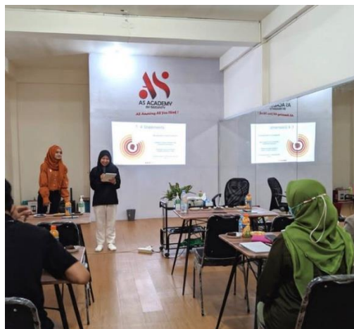
Gambar 4. 7 Praktek Public speaking

mengetahui teori nya terlebih dahulu walaupun pada dasarnya praktek yang lebih penting, tetapi teori juga tidak kalah penting, karena dengan teori itu dia memiliki dasar-dasar nya terlebih dahulu bahwa seperti apa tips dan trik dalam melakukan public speaking , kemudian setelah dia memahami untuk menjadi mahir, peserta harus banyak melakukan praktek dan banyak mengambil kesempatan dalam setiap acara atau dalam setiap event untuk mempraktekkan public speaking nya. Dari hal yang terkecil dan dari hal memberikan pendapat, bertanya kepada orang lain atau narasumber sampai dia berani untuk mengemukakan sesuatu dan mengemukakan pendapat atau dia menjadi presenter atau narasumber dalam suatu kegiatan. 73