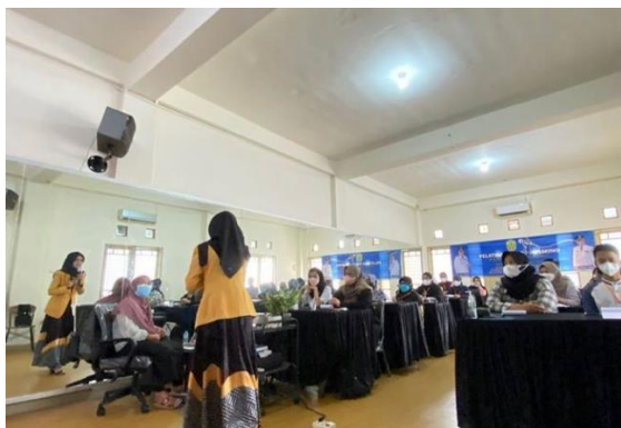
Gambar 4. 11 Trainer Memberikan Materi

Dari kurikulum yang diberikan oleh Trainer , terbukti bahwa peserta AS Academy By Raisanty cukup berhasil untuk meningkatkan ilmu public speaking dan dapat meningkatkan kepercayaan diri mereka. Setelah mengikuti pelatihan public speaking , peserta juga harus terus berlatih agar lebih mampu tampil percaya diri saat di depan umum.