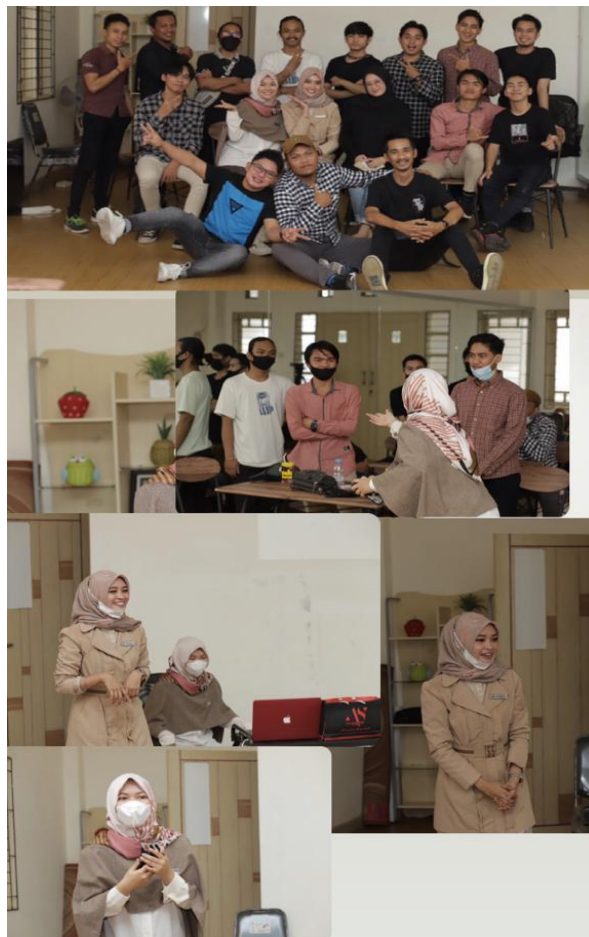
Gambar 4. 12 Keceriaan Peserta Saat Pelatihan

praktek kemudian ada evaluasi, Trainer juga dapat melibatkan mereka untuk terjun ke lapangan seperti melibatkan peserta untuk bisa menjadi moderator di kelas atau eventnya AS Academy By Raisanty . Dan setelah dilakukan strategi yang seperti ini memang bisa dibidang cukup efektif dan bermanfaat. Dibuktikan dengan banyaknya alumni yang sekarang sudah menjadi public speaker handal dan lebih percaya diri.