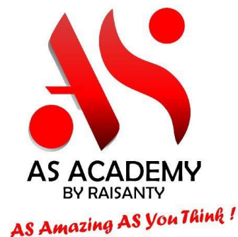
Gambar 4. 1 Logo AS Academy By Raisanty

AS Academy By Raisanty adalah sebuah perusahaan di bidang jasa komunikasi & pelatihan, berpusat di Banjarmasin berupa bisnis pelatihan atau bidang pendidikan, yakni dari mulai menyediakan tempat pelatihan atau kelas public speaking secara online maupun offline , menyediakan kelas Digital Marketing , sebagai pusat pelatihan Badan Nasional Sertifikasi Profesi (BNSP), menyediakan kelas Marketing Communication , dan menyediakan kelas Human Resources , serta menyediakan pelatihan dengan mendapatkan gelar non