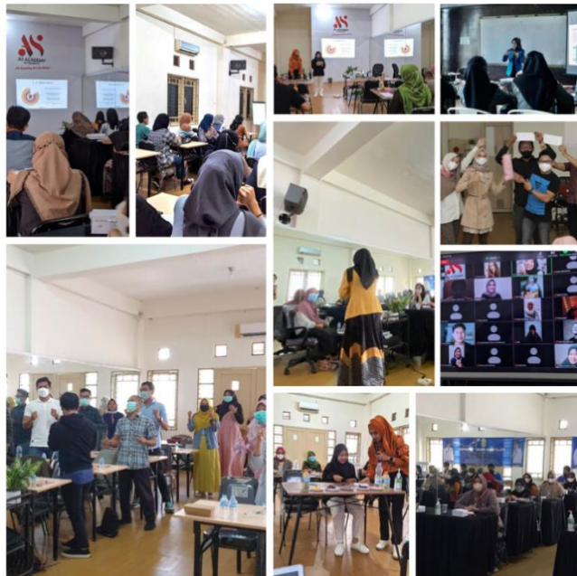
Gambar 4. 3 Foto Pelatihan di AS Academy By Raisanty