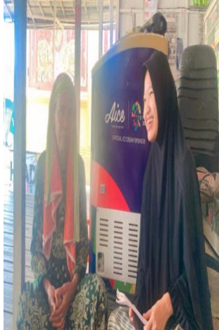
6.1 Ibu Imis