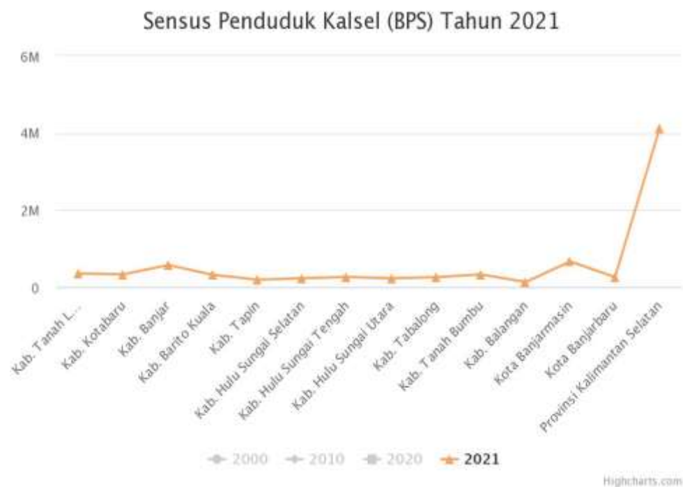
Gambar 4. 1 Grafik Jumlah Penduduk Kalimantan Selatan

Dari tabel dan gambar gravik dari Badan Pusat Statistik (BPS) Kalimantan selatan di atas dapat dilihat bahwa Kota Banjarmasin memiliki penduduk terbanyak di bandingkan kota dan kabupaten lain yang ada di Provinsi Kalimantan Selatan, yaitu 662.320 jiwa pada tahun 2021.