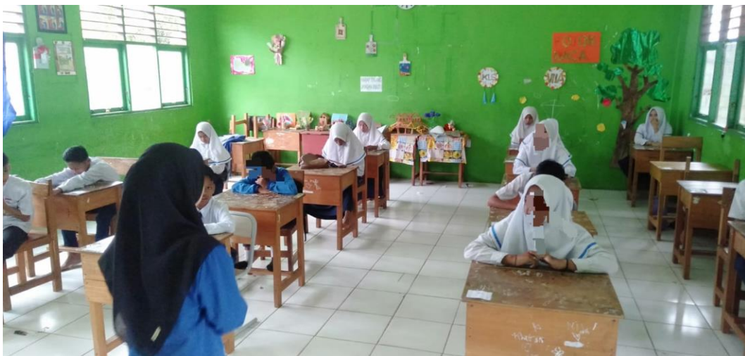
Gambar 4. Pemberian treatment pertemuan ketiga