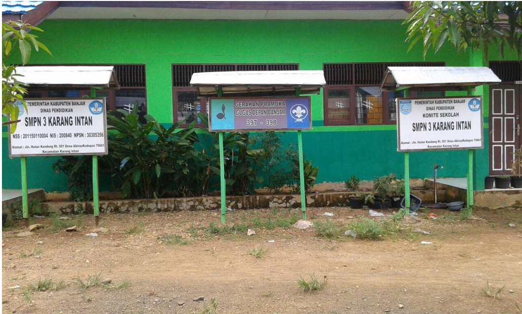
Gambar 1. SMP Negeri 3 Karang Intan