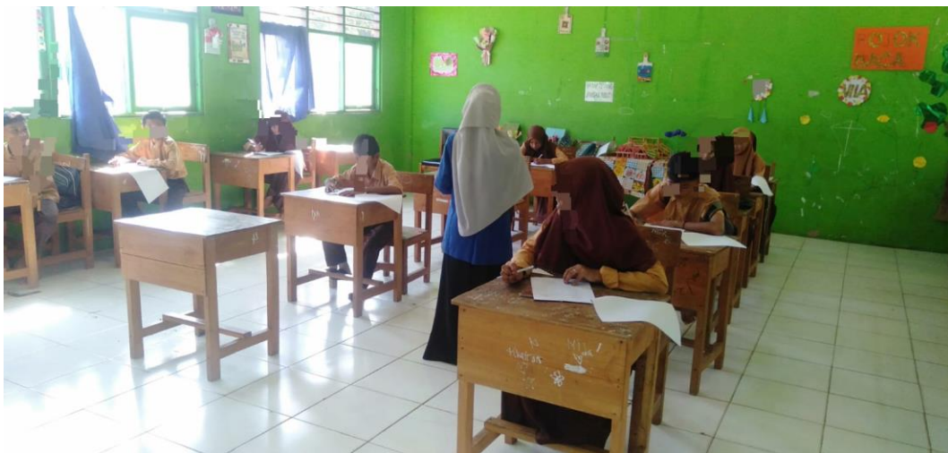
Gambar 2. Pemberian treatment pertemuan pertama