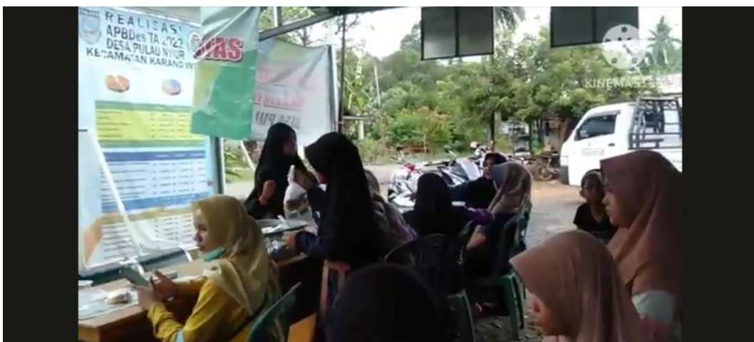
Gambar 3. Video contoh dampak pernikahan usia dini aspek sosial