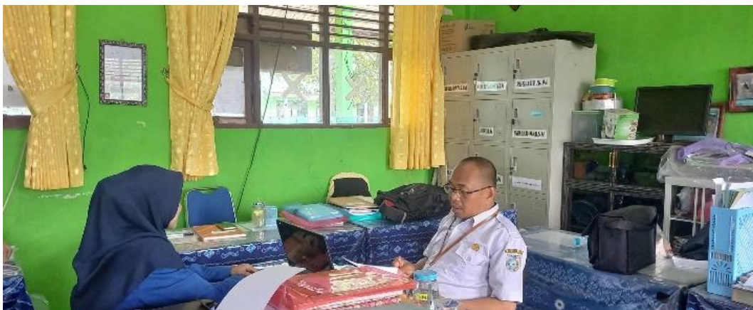
Gambar 5. Evaluasi bersama Guru BK