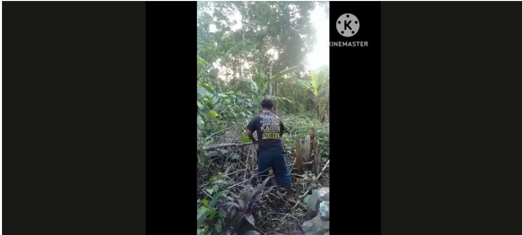
Gambar 1. Video contoh dampak pernikahan usia dini aspek ekonomi