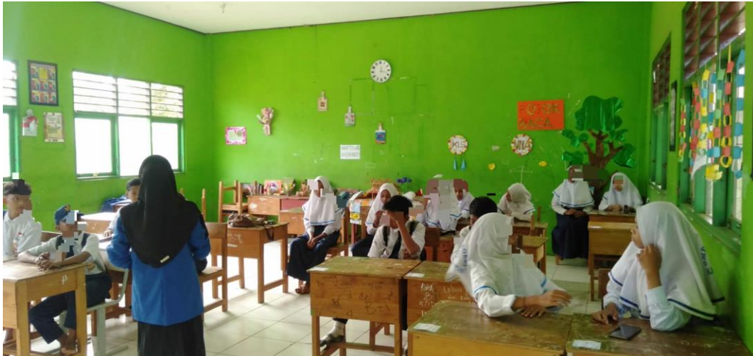
Gambar 3. Pemberian treatment pertemuan kedua