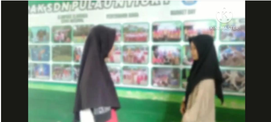
Gambar 4. Video contoh dampak pernikahan usia dini aspek pendidikan