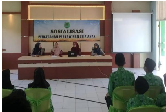
Gambar 2.4 Kegiatan Sosialisasi PUSPAGA

Sedangkan dalam program pelayanan pasif, tenaga kerja Pusat Pembelajaran Keluarga (PUSPAGA) tidak mendatangi tempat-tempat atau turun ke lapangan melainkan hanya bekerja di dalam ruangan kerja saja. Program pelayanan tersebut adalah konseling. Konseling ini terdiri dari berbagai tema yang berhubungan dengan keluarga seperti konseling pernikahan, pengasuhan anak, dan yang lainnya.