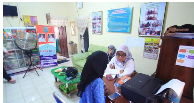
Gambar 3.4 Pelayanan Konseling PUSPAGA

Sedangkan dalam program pelayanan pasif, tenaga kerja Pusat Pembelajaran Keluarga (PUSPAGA) tidak mendatangi tempat-tempat atau turun ke lapangan melainkan hanya bekerja di dalam ruangan kerja saja. Program pelayanan tersebut adalah konseling. Konseling ini terdiri dari berbagai tema yang berhubungan dengan keluarga seperti konseling pernikahan, pengasuhan anak, dan yang lainnya.