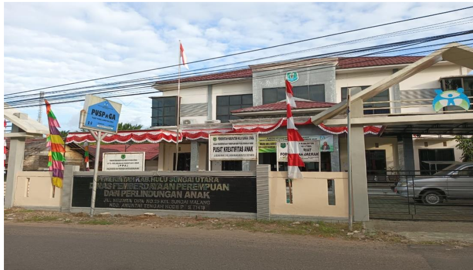
Gambar 1.4 DPPPA Kabupaten Hulu Sungai Utara