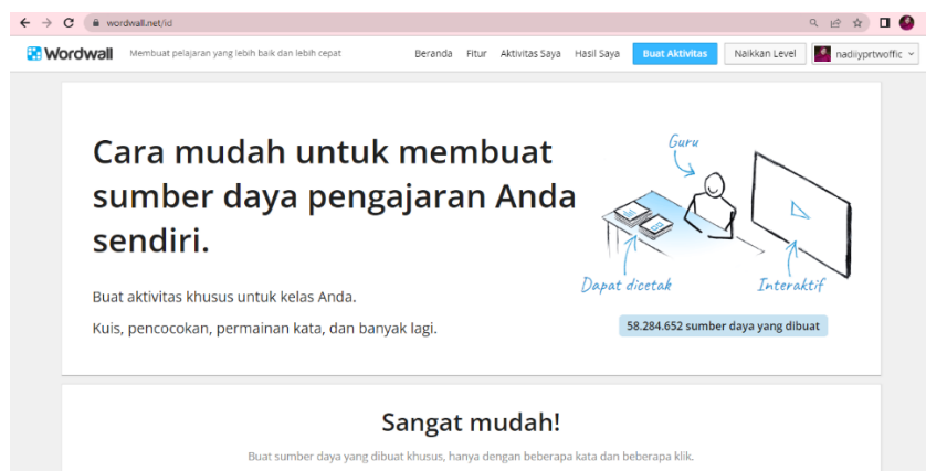
Gambar 4.1. Tampilan Beranda Website Wordwall

https://wordwall.net/ game ini dapat digunakan untuk menunjang proses pembelajaran dikala pandemi covid-19, dimana guru memberikan tugas melalui game tersebut sehingga pembelajaran tetap berjalan terkhususnya pada kegiatan menghubungkan gambar dengan kata. Game wordwall ini juga dapat digunakan sebagai media pembelajaran di kala pembelajaran luring atau pembelajaran tatap muka. Game wordwall tersebut berisi macam-macam templat untuk membuat permainan-permainan atau game yang edukatif.