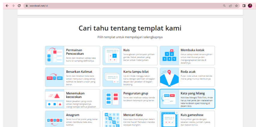
Gambar 4.3. Tampilan Beranda Game Wordwall