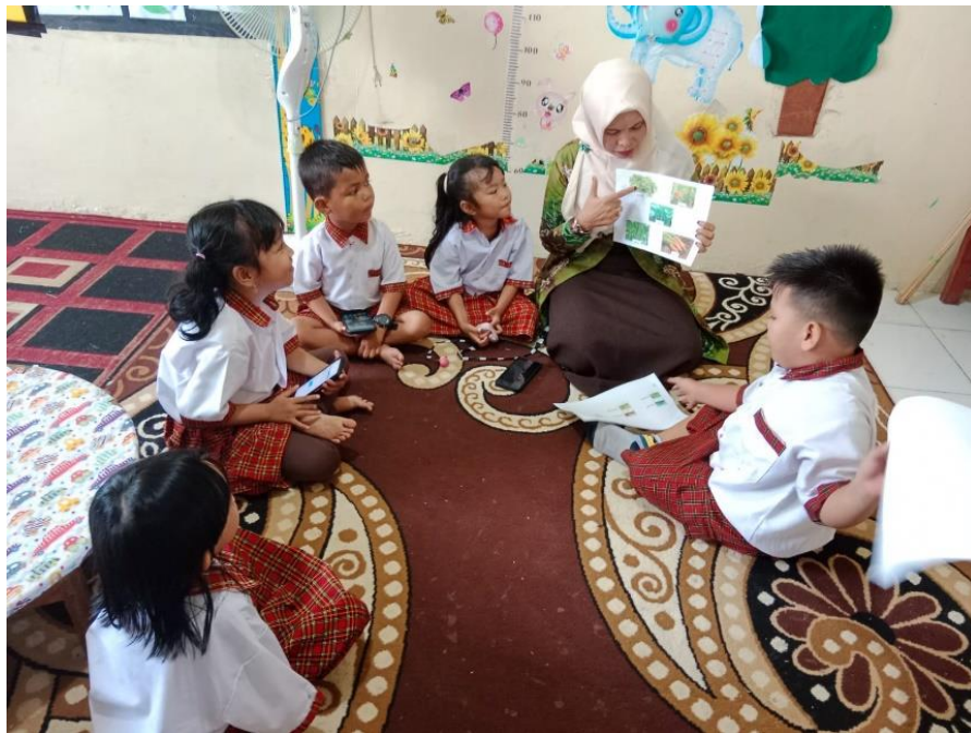
Gambar 4.4. Guru Menjelaskan Cara Memainkan Game Wordwall

dengan melakukan perekaman layar untuk menjelaskan dari cara membuka tautannya sampai cara memainkannya.