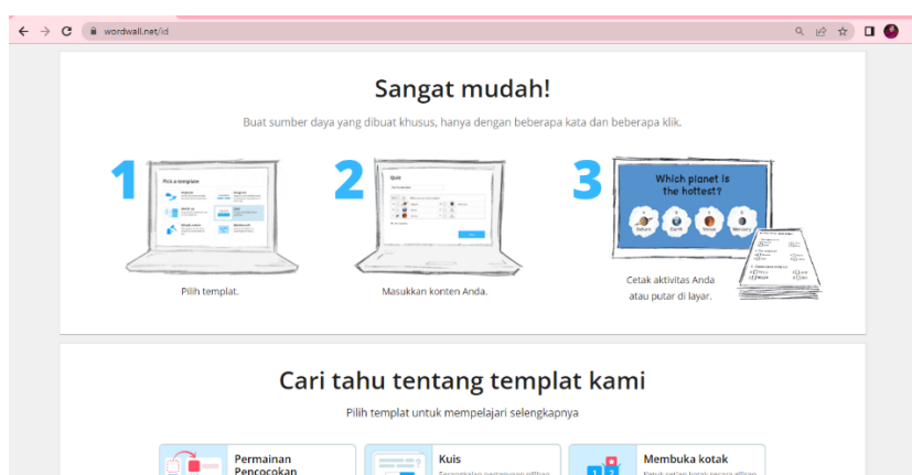
Gambar 4.2. Tampilan Beranda Website Wordwall