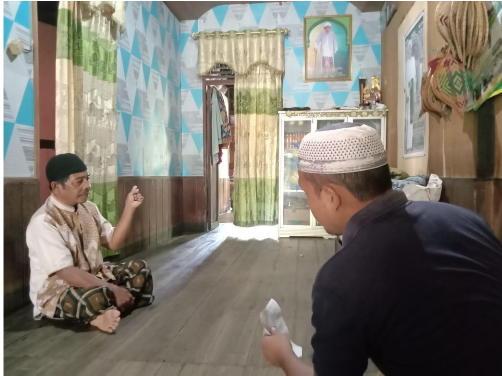
Wawancara dengan tokoh masyarakat, tanggal 11-04-2023