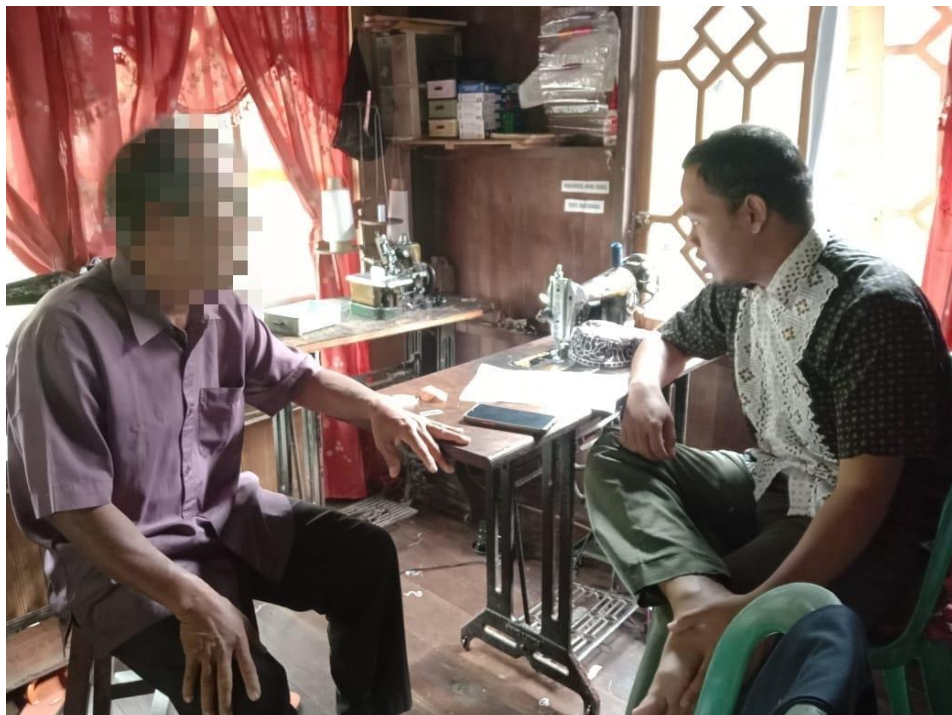
Wawancara informan pada tanggal : 07-04-2023