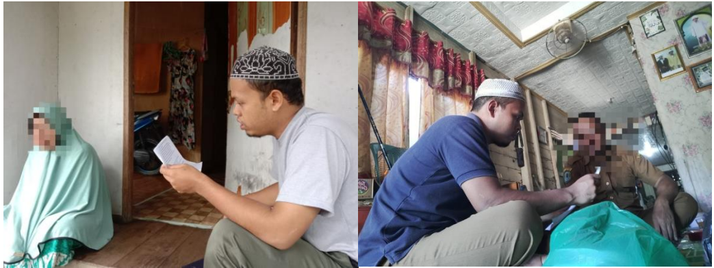
Wawancara informan pada tanggal : 11-04-2023