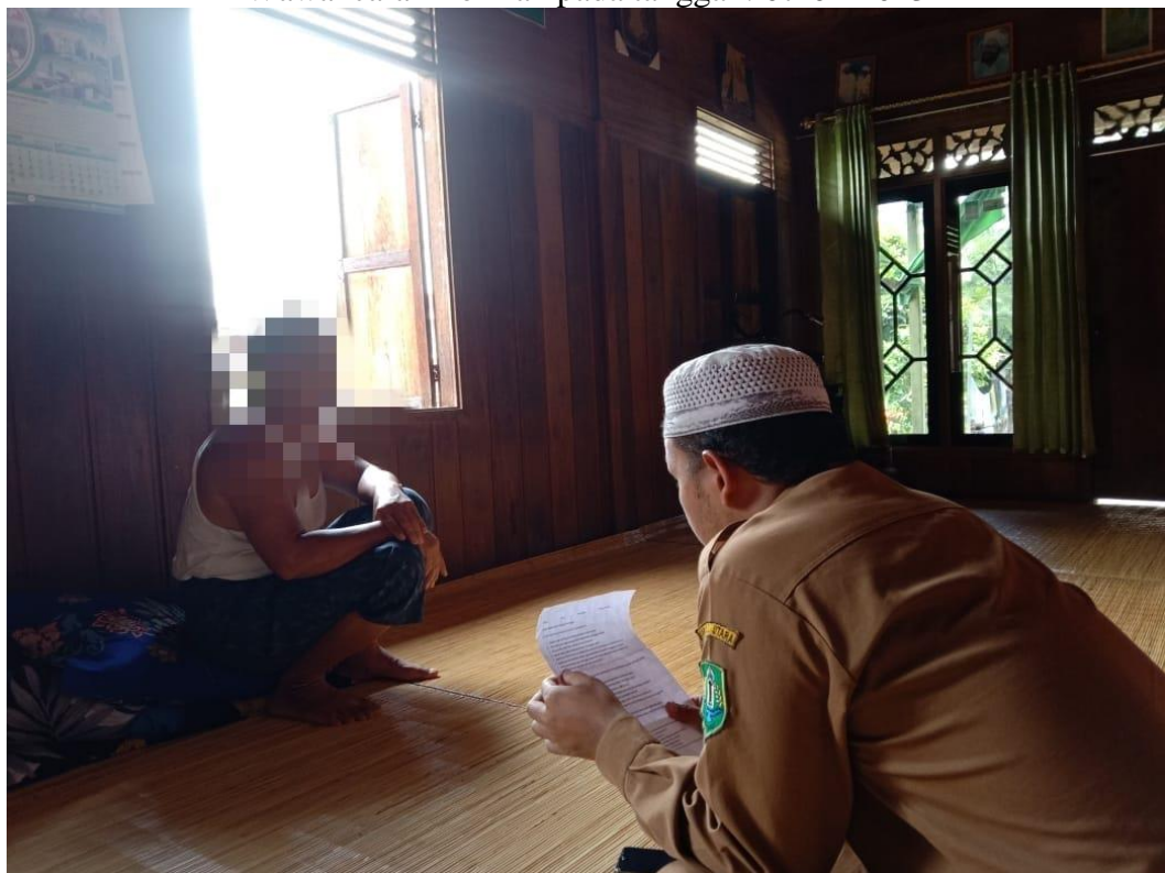
Wawancara informan pada tanggal : 10-04-2023