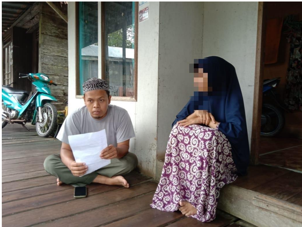
Wawancara informan pada tanggal : 07-04-2023