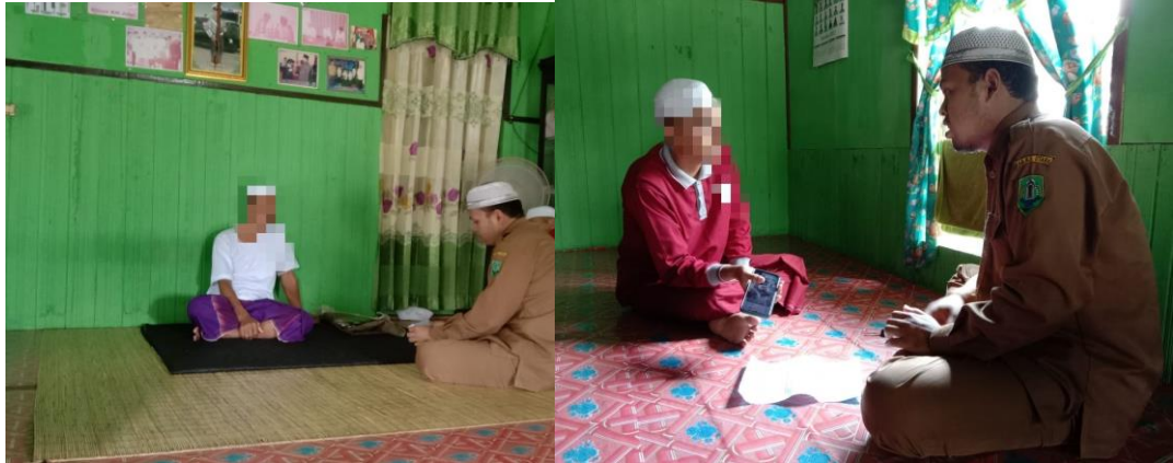
Wawancara informan pada tanggal : 10-04-2023