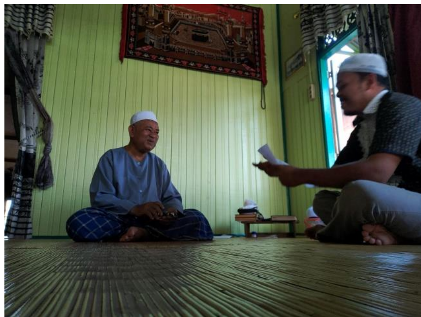
Wawancara dengan tokoh masyarakat, tanggal 09-04-2023