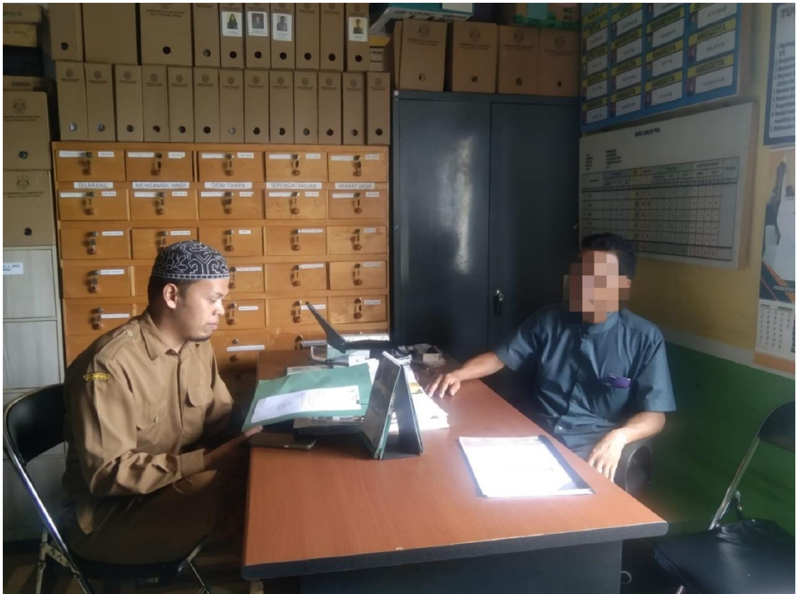
Wawancara informan pada tanggal : 04-04-2023