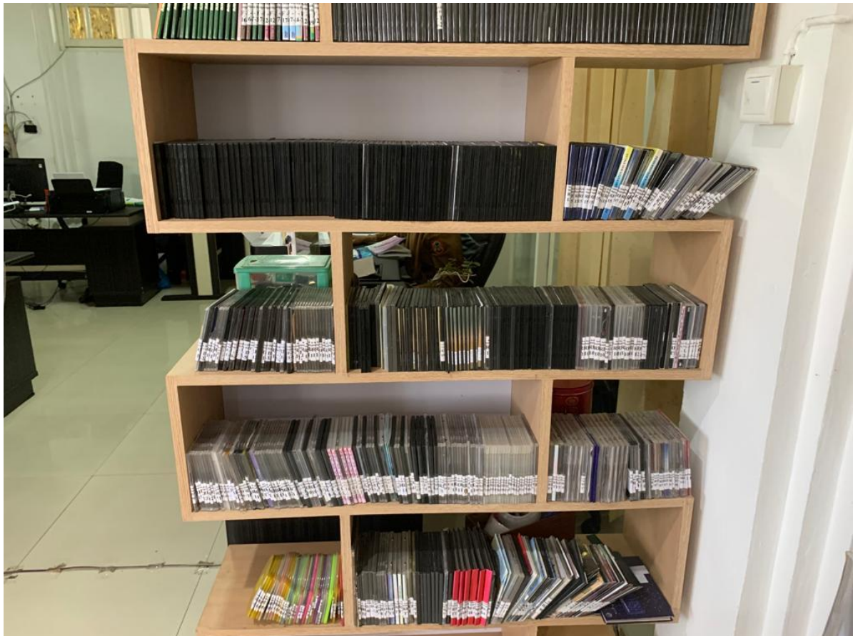
Gambar 8 Koleksi Rekam di Ruang Deposit