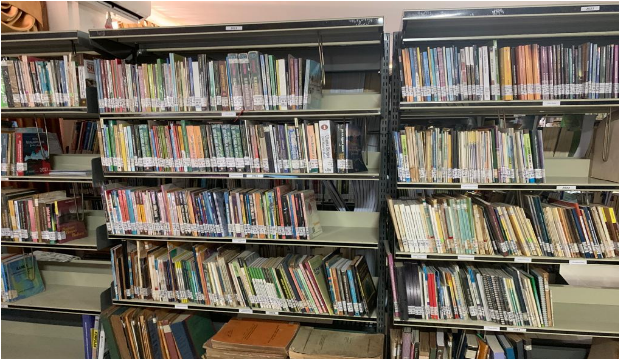
Gambar 7 Koleksi Karya Cetak di Ruang Deposit