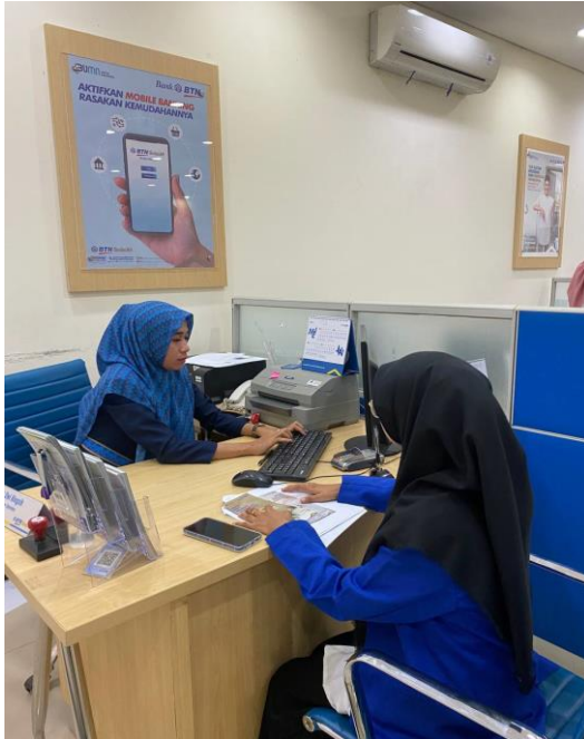
FOTO BERSAMA INFORMAN