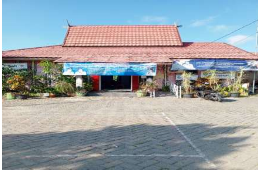
Gambar 4.2 Kelurahan Mantuil

Sumber dokumentasi foto pribadi tanggal 19 Juni 2023