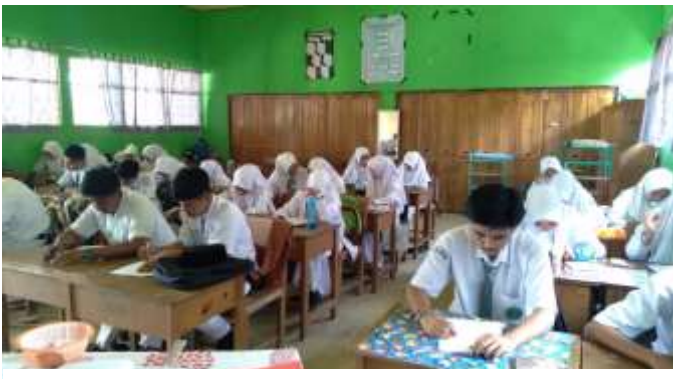
PENGISIAN ANGKET OLEH KELAS XII MIPA 2