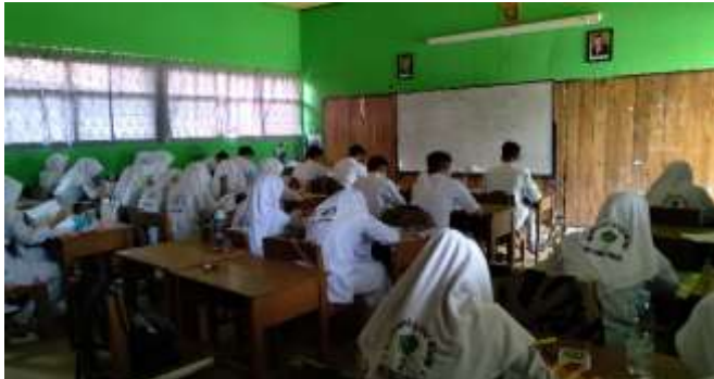
PENGISIAN ANGKET OLEH KELAS XII MIPA 1