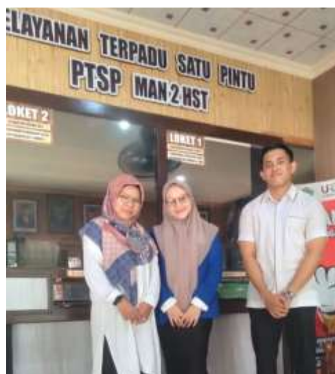
FOTO BERSAMA GURU BK MAN 2 HST