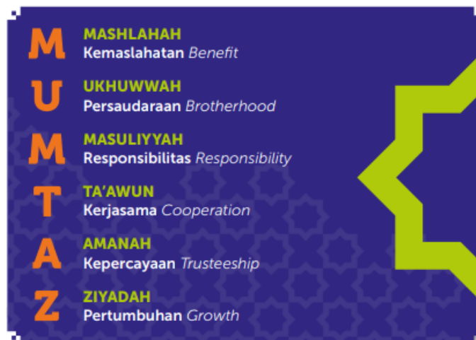
Gambar II. Budaya Perusahaan PT. Penjaminan Jamkrindo Syariah