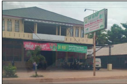
Gambar 4.2 Aset Produktif Pondok: DH Mart