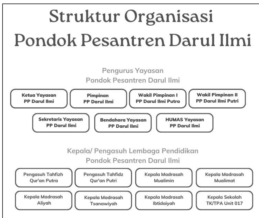
Gambar 4.4. Struktur Organisasi Ponpes Darul Ilmi

sekretaris, bendahara dan humas. Gambar lengkapnya bisa dilihat pada gambar 4.4.