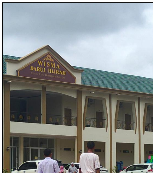
Gambar 4.3 Aset Produktif Pondok: Wisma Darul Hijrah