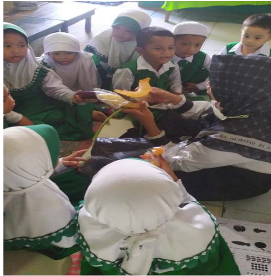
Gambar 4.3 Foto Kegiatan Bercakap-Cakap dengan Tema Sayuran

Berdasarkan hasil dokumentasi pada gambar 4.2, peserta didik fokus terhadap media atau benda yang saat itu dipegang pendidik. Mereka memfokuskan diri mereka terhadap benda yang menarik di sekitar mereka. 39