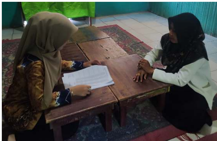
Gambar 4.4 Wawancara Peneliti dengan Guru Kelompok A. 42

Berdasarkan paparan hasil wawancara dengan pendidik dan kepala sekolah diatas terkait metode yang tepat untuk membantu peserta didik mengembangkan kemampuan berkomunikasi, memberikan penegasan bahwa metode yang baik dan menyenangkan saja belum cukup untuk membantu pendidik mencapai tujuan dalam penelitian ini adalah kemampuan berkomunikasi anak. Oleh karena itu diperlukannya metode yang juga tepat agar hasil yang diinginkan maksimal.