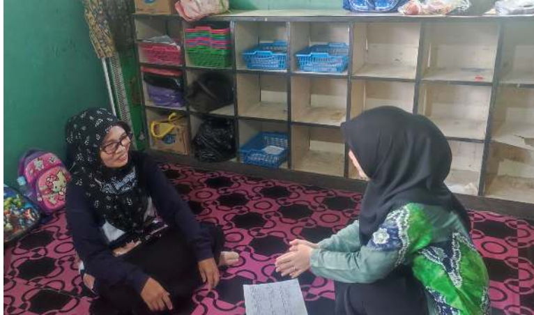
Gambar 4.2 Wawancara Peneliti dengan Kepala Sekolah. 36

tentu saja penting untuk anak usia dini yang masih dalam tahap perkembangan dan pertumbuhan. 35