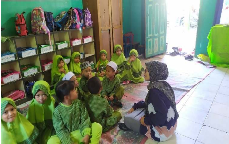
Gambar 4.5 Foto Kegiatan Metode Bercakap-Cakap dengan Tema Alam Semesta. 44

Sebagaimana hasil observasi terhadap kegiatan pembelajaran menggunakan metode bercakap-cakap dengan tema alam semesta subtema gejala alam, peserta didik akhirnya dapat menambah pengetahuan tentang apa saja gejala alam yang ada disekitar mereka. Dengan metode bercakap-cakap pula membantu peserta didik memahami kata maupun kalimat yang sebelumnya tidak mereka pahami karena tidak terbiasa didengar telinga mereka. 45