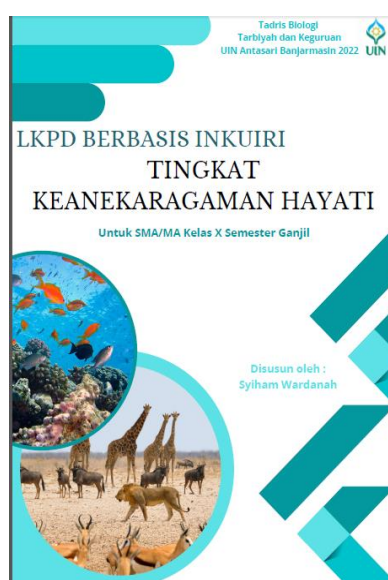
Gambar 3.2 Rancangan Cover LKPD berbasis Inkuiri