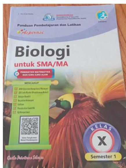
Gambar: 3.1 Cover LKPD Biologi Sekolah

keanekaragaman hayati menggunakan aplikasi yaitu Canva . LKPD Berbasis Inkuiri dirancang menggunakan ukuran kertas A4. Batasan umum yang dapat dijadikan pedoman pada saat menentukan desain LKPD yaitu ukuran, kepadatan halaman, penomoran halaman, kombinasi warna, dan kejelasan pada LKPD tersebut. Berikut Perubahan cover LKPD pada buku sebelumnya dengan LKPD berbasis inkuiri sebagaimana pada gambar 3.1 dan 3.2 berikut ini.