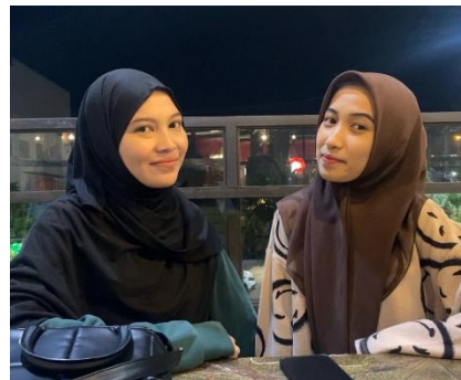
Wawancara bersama Amma