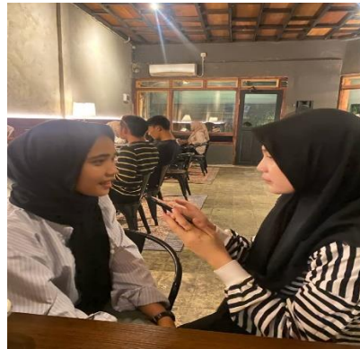
Wawancara bersama Aau