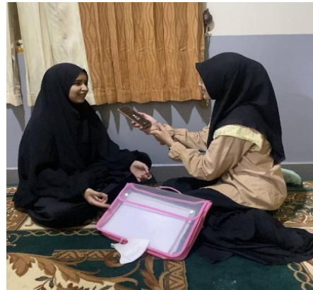
Wawancara bersama Kanah