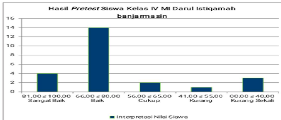
Gambar 4.3 Hasil Pretest Siswa Kelas IV MI Darul Istiqamah Banjarmasin

Seperti yang dapat dilihat pada nilai di atas dapat di ketahui bahwa nilai tertinggi, terendah, rata-rata dan standar deviasi ditunjukkan pada tabel dibawah.