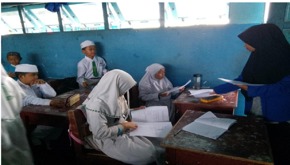
Gambar 4.4 Aktivitas Siswa Kelas IV Saat Dilaksanakan Pretest

Adapun pelaksanaan saat pretest dapat dilihat pada gambar berikut: