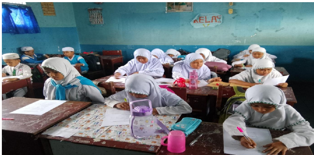
Gambar 4.6 Aktivitas Siswa Kelas IV Saat Melaksanakan Posttest