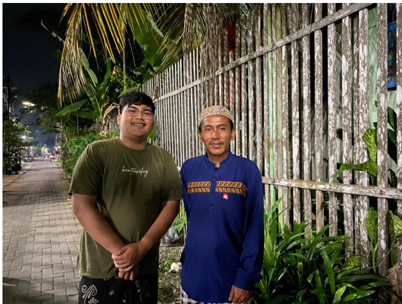
(Said Masyarakat Banjarmasin Barat)