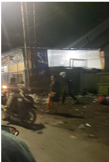
(TPS Banjarmasin Selatan, JL. Yudistira Beruntung Jaya)