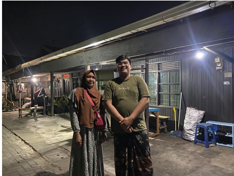
(Yanti Masyarakat Banjarmasin Barat)