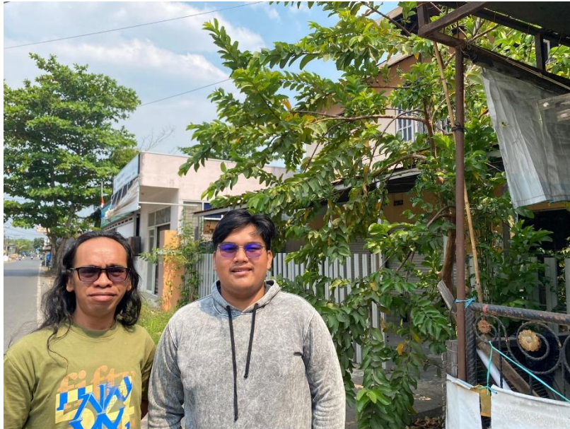
(Harun Masyarakat Banjarmasin tengah)