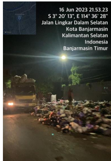
(TPS Banjarmasin Timur, JL. Lingkar Dalam Selatan)