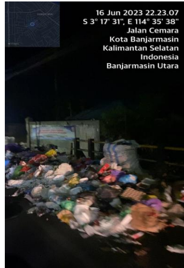
(TPS Banjarmasin Utara, JL. Cemara)