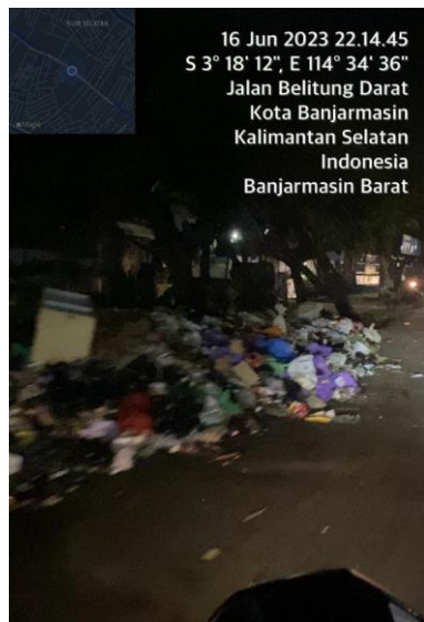
(TPS Banjarmasin Barat, Jl. Belitung Barat)