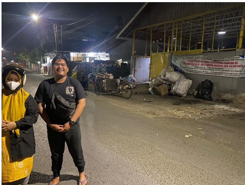
(Alya, S.E., Masyarakat Banjarmasin Selatan)