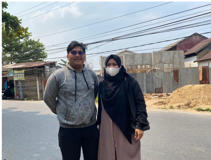
(Khoirul Izzah Masyarakat Banjarmasin Tengah)