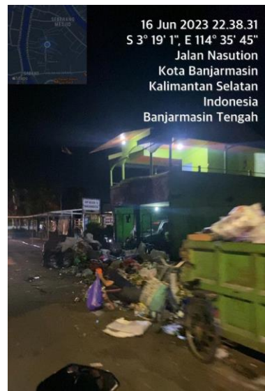
(TPS Banjarmasin Tengah, Jl. Aes Nasution)