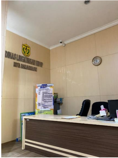
(Dinas Linnkungan Hidup Kota Banjarmasin)