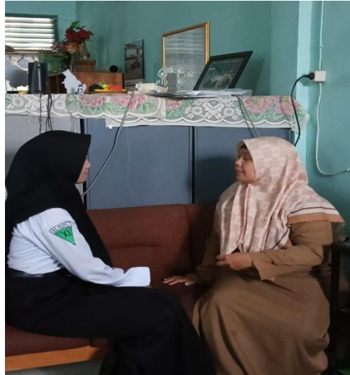
Ruangan Bimbingan Dan Konseling