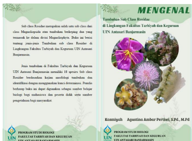
Gambar 3.1. Cover booklet Rancangan Peneliti

Tahapan ini diawali menyusun kerangka booklet , menentukan judul booklet , membuat desain cover booklet . Selanjutnya merancang outline booklet dan mengkaji hasil penelitian berkaitan dengan topik penelitian yang sedang dikembangkan. Selanjutnya mengembangkan booklet berdasarkan hasil kajian lapangan tentang tumbuhan Sub Classis Rosidae di lingkungan Fakultas Tarbiyah dan Keguruan UIN Antasari Banjarmasin. Adapun cover booklet yang akan dikembangkan oleh peneliti dapat dilihat pada gambar 3.1 di bawah ini.