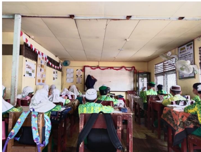
4.2 Observasi di kelas IV MI Nurul Islam

pembelajaran dikelas. Fungsi dari modul ajar sendiri guna meringankan beban guru dalam menyajikan konten sehingga guru dapat memiliki banyak waktu menjadi tutor dan membantu banyak peserta didik pada proses pembelajaran. 13 Dibalik kemudahan itu seorang guru harus lebih memperhatikan perkembangan peserta didik karena perencanaan yang di buat belum tentu sesuai dengan keadaan dan kebiasaan siswa di kelas. Perencanaan pembelajaran yang telah di buat memiliki strategi dan metode yang sama di setiap pembelajaran. Perlunya strategi dan metode pembelajaran yang bervariasi akan membuat peserta didik tidak jenuh.