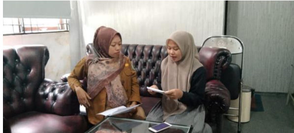
Gambar 5.1 Wawancara dengan pustakawan