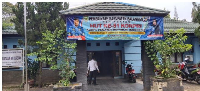
Gambar 5.3 Kantor perpustakaan