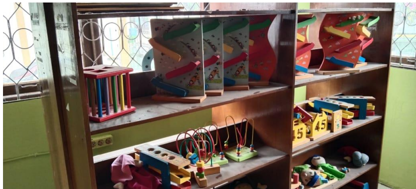
Gabar 5.6 Ruang Anak