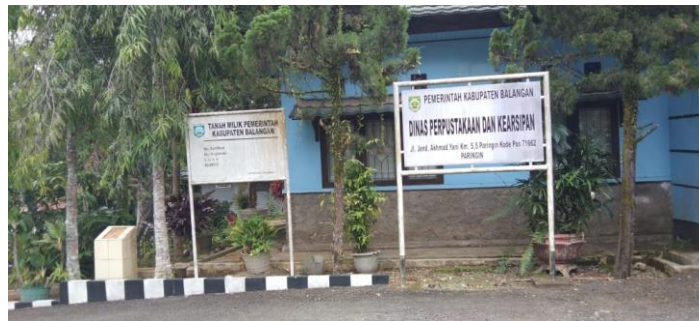
Gambar 5.4 Samping Kantor perpustakaan