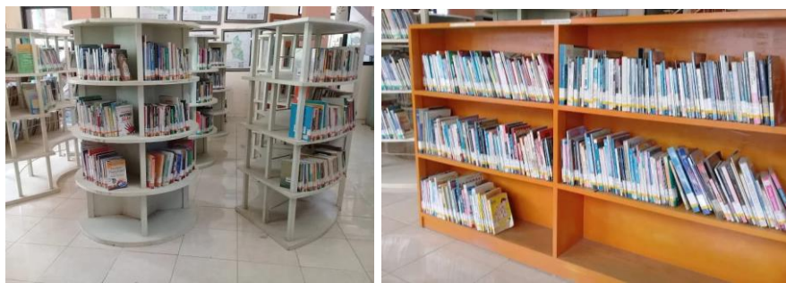
Gambar 5.5 Rak Buku