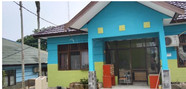
Gambar 5.2 Gedung perpustakaan