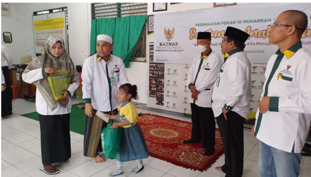
Lampiran 2: Foto Pimpinan BAZNAS 2022-2026