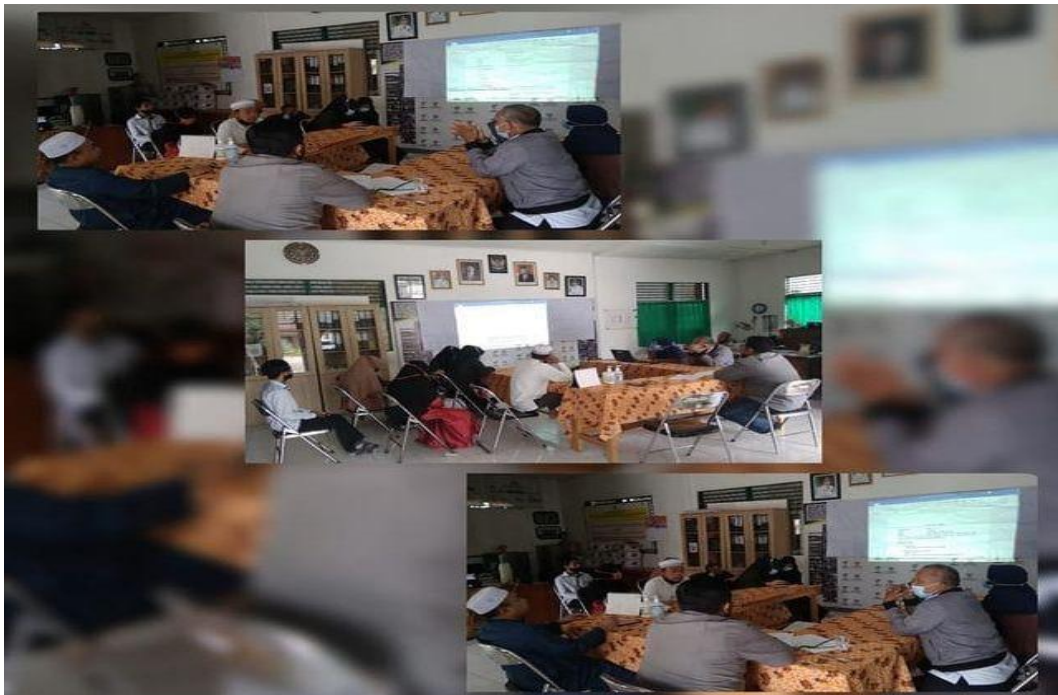
Lampiran 13: Foto pada saat rapat internal bersama BAZNAS Kabupaten Tanah Laut