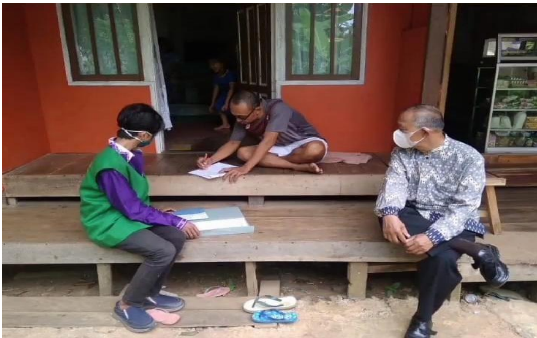
Lampiran 10: Survei dan verifikasi data mustahik bersama wakil IV pimpinan BAZNAS Kabupaten Tanah Laut