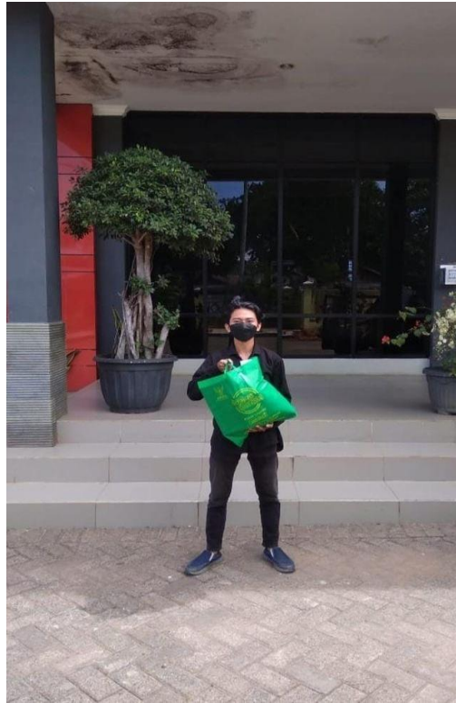
Lampiran 14: Foto pembagian paket logistik