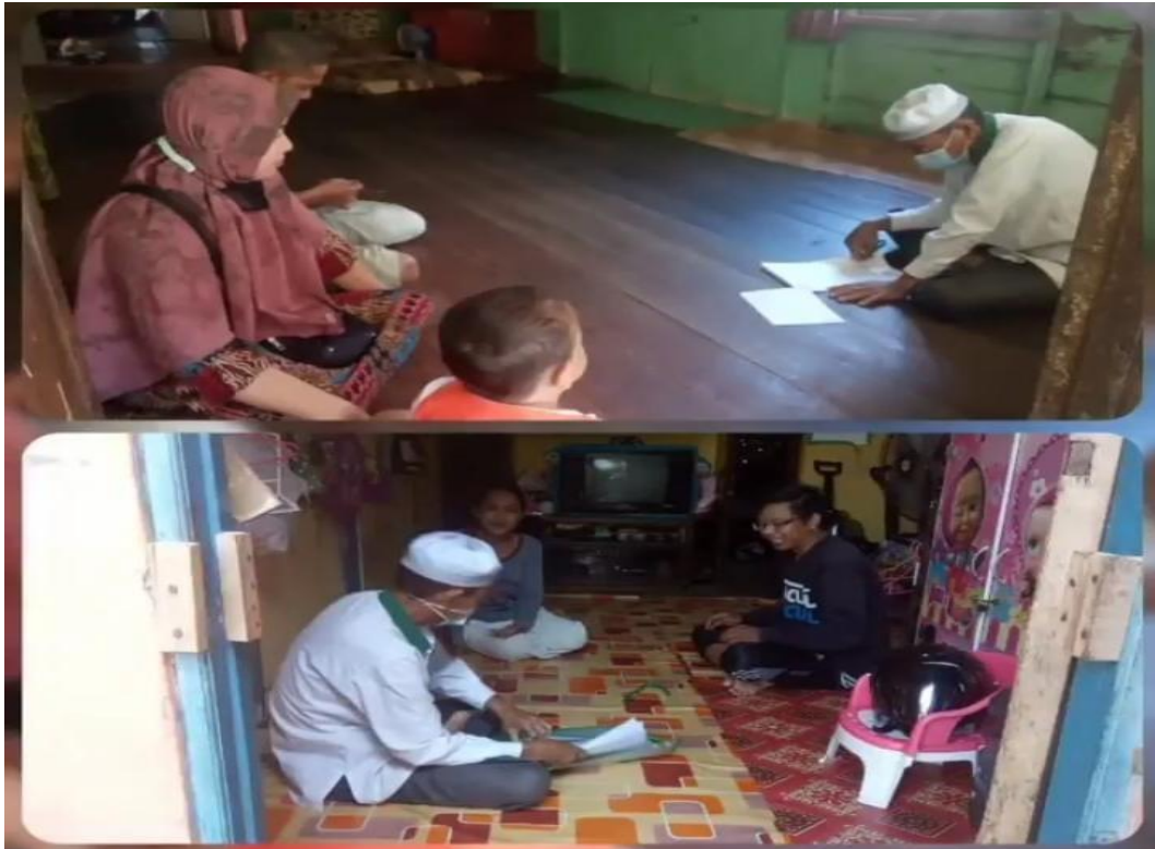
Lampiran 9: Survei dan verifikasi data mustahik bersama wakil III pimpinan BAZNAS Kabupaten Tanah Laut