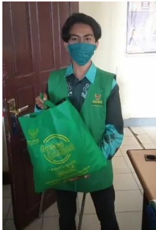
Lampiran 15: Foto pembagian paket logistik