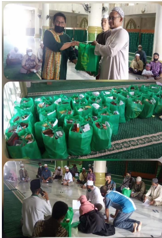
Lampiran 8: Foto pembagian paket logistik kepada kaum masjid program dakwah dan advokasi