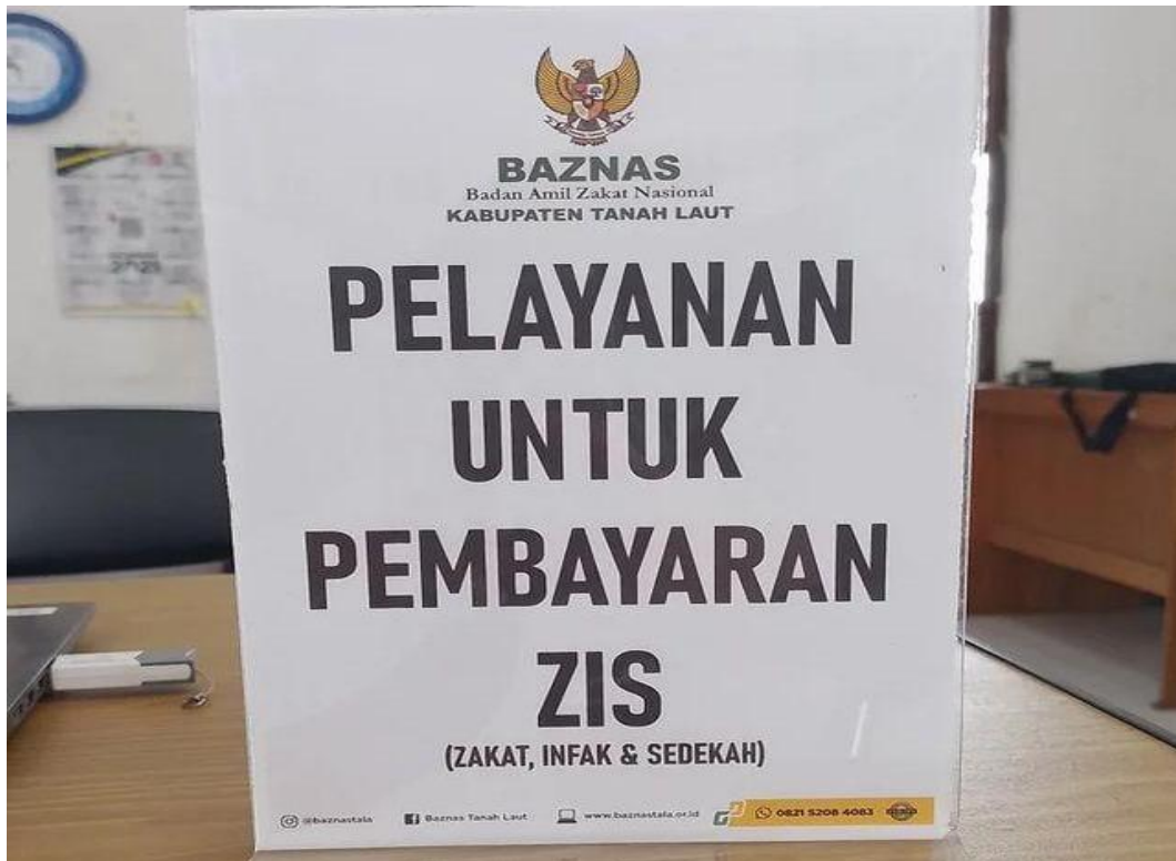
Lampiran 12: Foto plakat untuk pelayanan pembayaran Zakat, Infak dan Sedekah di Kantor BAZNAS Kabupaten Tanah Laut