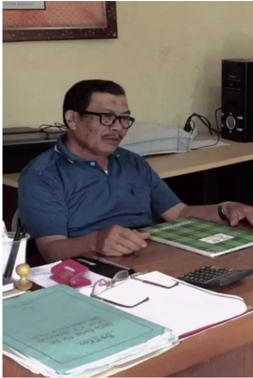
Lampiran 5: Foto pada saat wawancara bersama ketua yayasan panti asuhan tuntung pandang penerima program kemanusiaan