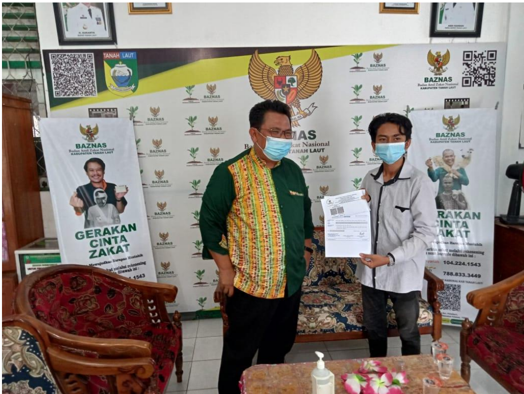
Lampiran 1: Foto bersama pimpinan BAZNAS 2016-2021