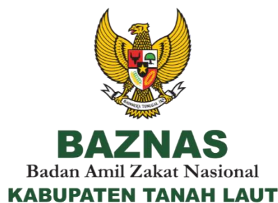
Gambar 4.1 : Logo BAZNAS Kabupaten Tanah Laut