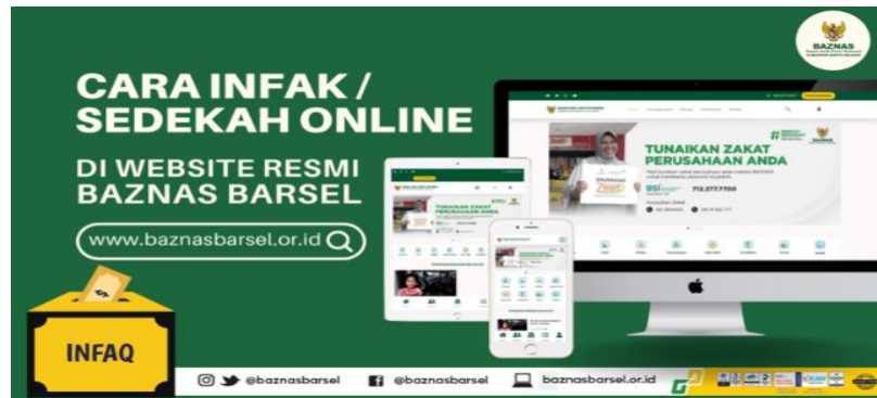
Gambar 4.2 : Aplikasi Pemberdayaan Zakat

Sumber data dari website BAZNAS Baznas Barito Selatan