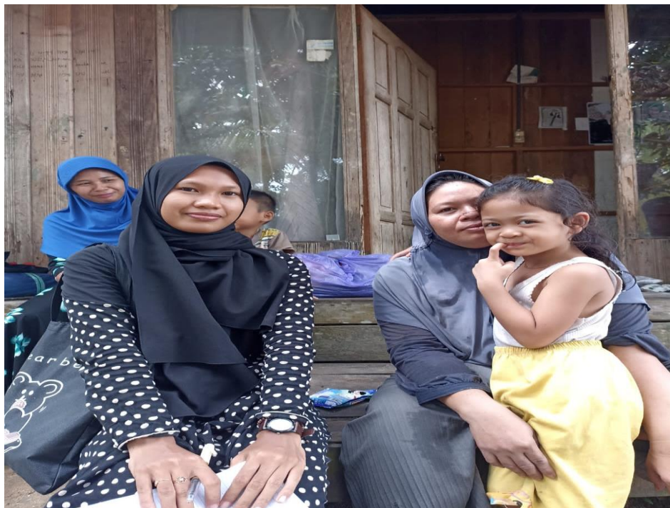
Wawancara dengan Ibu Ms masyarakat sekaligus pernah mengikuti baayun maulid (01 Februari 2023)