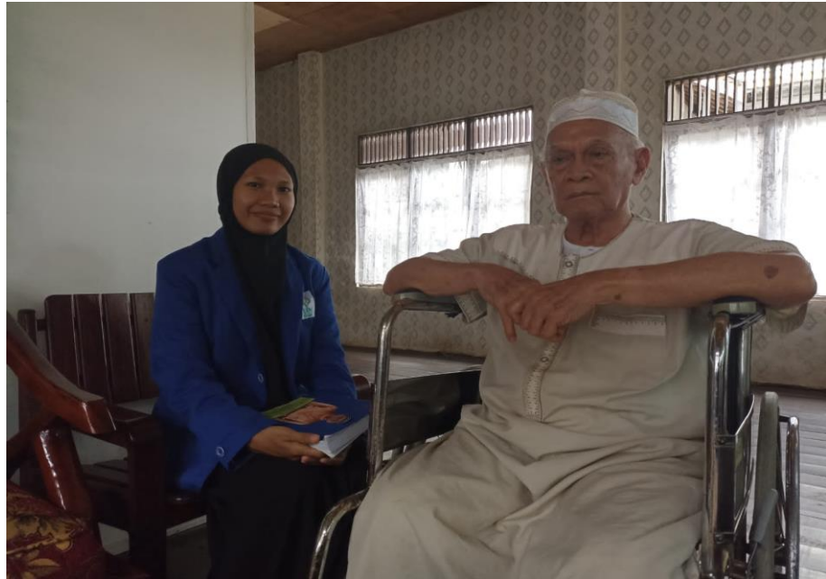
Wawancara dengan Sejarawan sekaligus Budayawan Tapin, Bapak GU (02 Februari 2023)