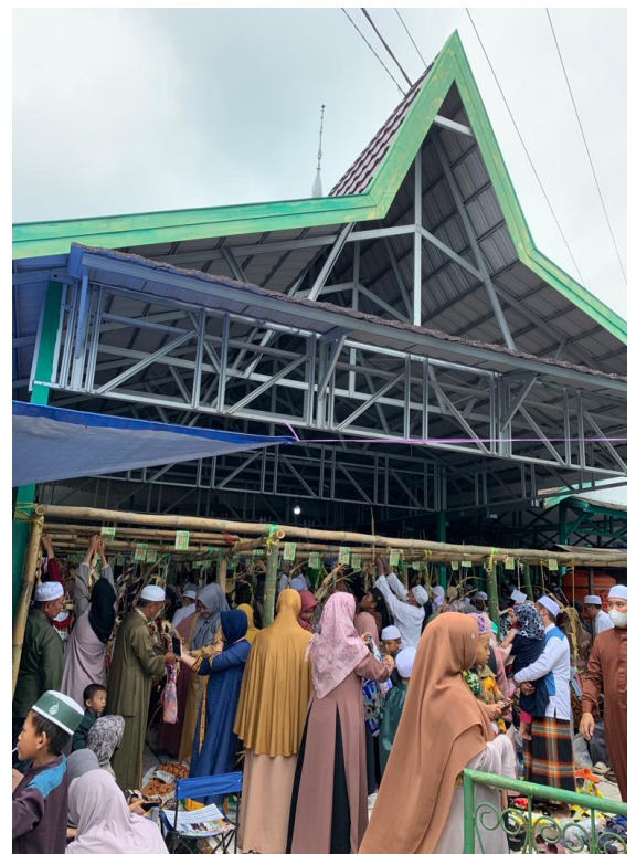
Suasana di dalam dan sekitaran Masjid Keramat al-Mukarromah sebelum acara dimulai