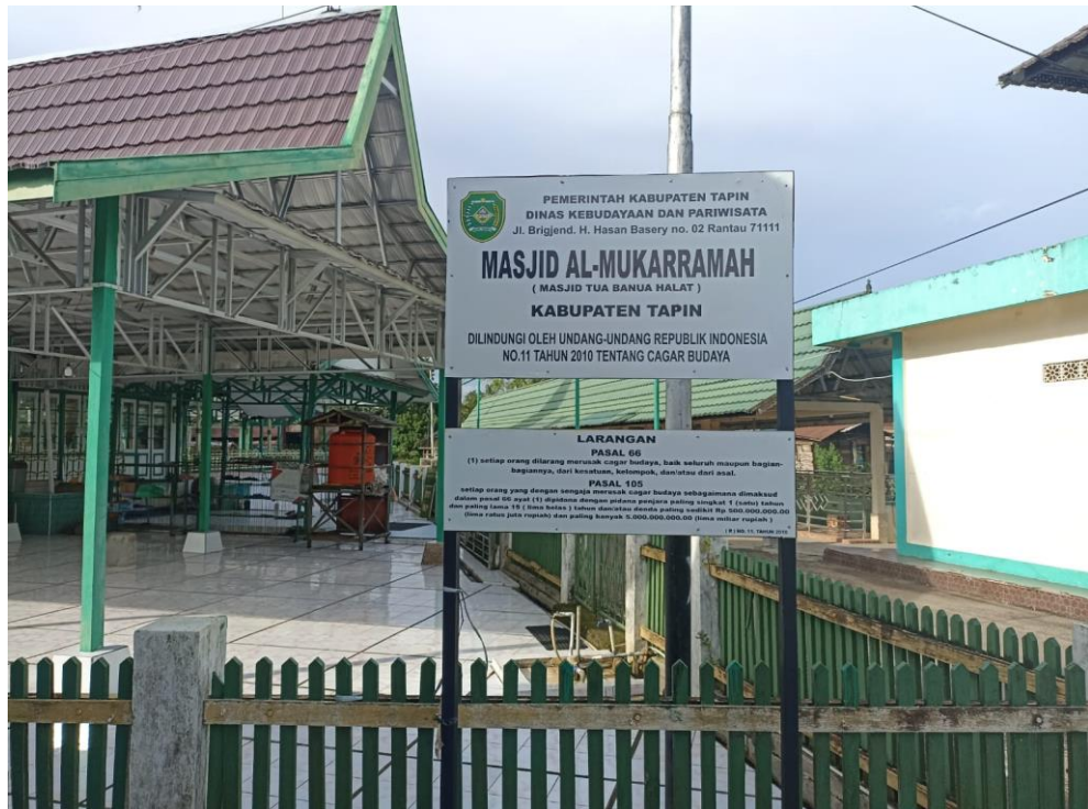
Masjid Keramat sebagai salah satu Masjid yang tertua dan dilindungi oleh Pemerintah Kabupaten Tapin