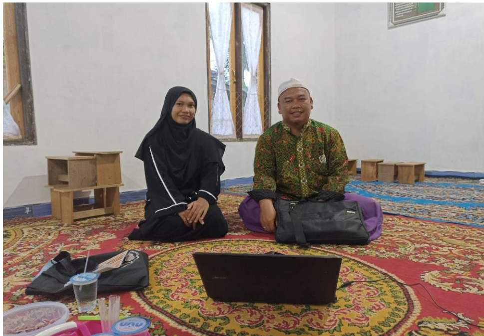
Wawancara dengan panitia pelaksana baayun maulid sekaligus Tokoh Agama Banua Halat, Bapak Mr (31 Januari 2023)