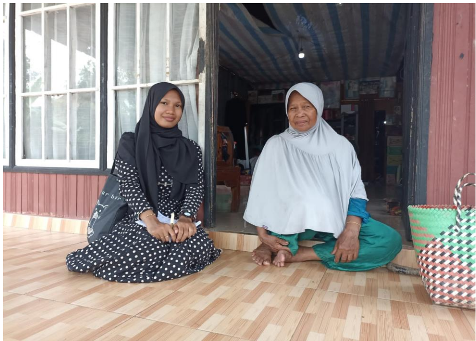
Wawancara dengan Ibu Rm, Masyarakat Banua Halat Kiri (01 Februari 2023)