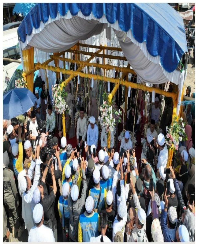
Hiasan ayunan yang terdiri dari berbagai janur pelaksanaannya juga diikuti dan dihadiri oleh para alim ulama dan habaib