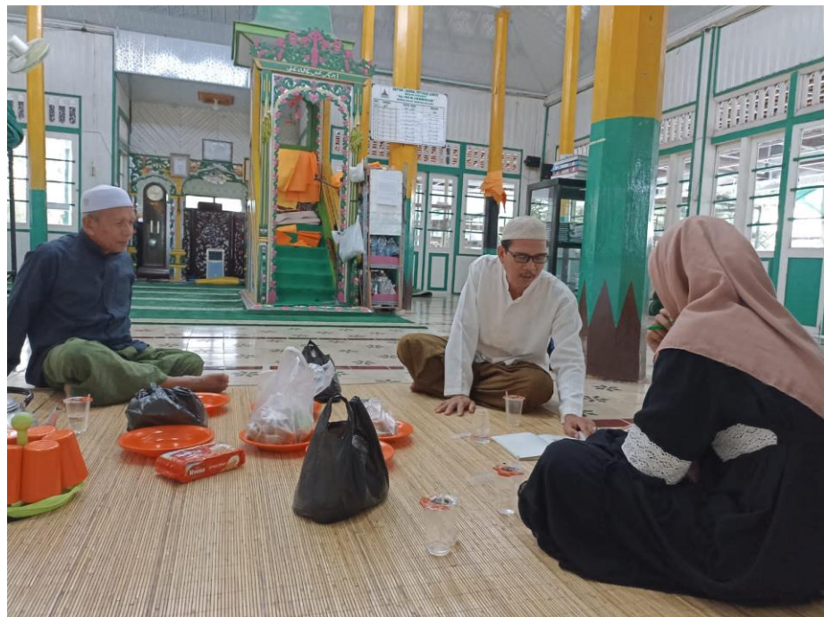
Wawancara dengan Ketua Panitia Baayun Maulid dan Kaum Masjid (Bapak HA dan Yy) di Masjid Keramat al-Mukarromah Banua Halat Kiri (16 Januari 2023)