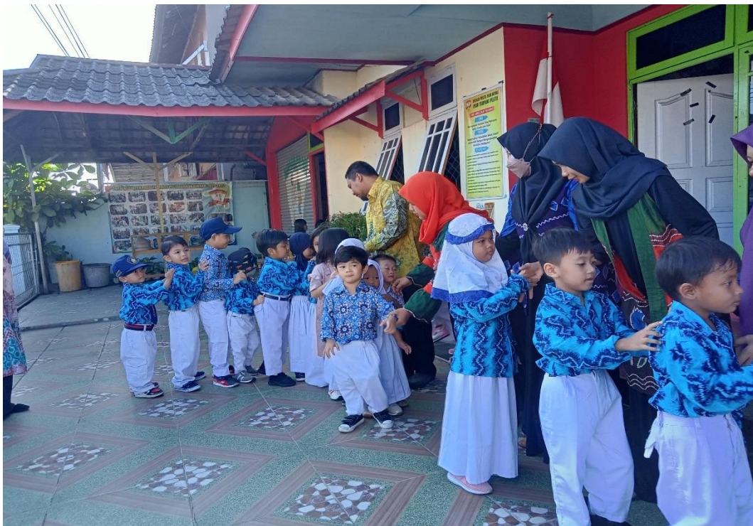
Salam-salaman setelah apel pagi