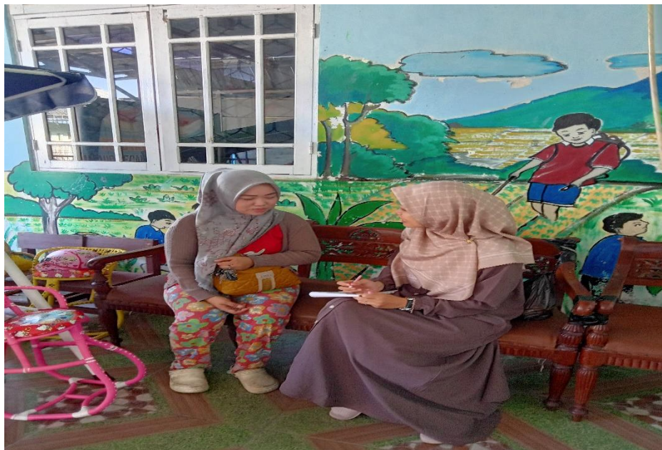
Wawancara dengan Ibu Nita (Orang tua anak)