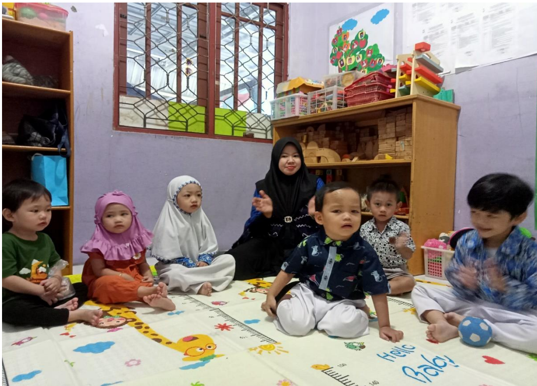
Bernyanyi sebelum mulai pembelajaran