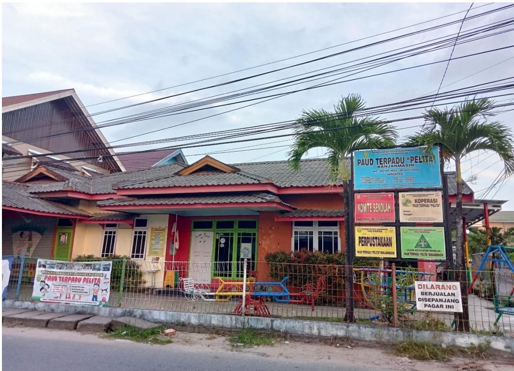
PAUD Terpadu Pelita