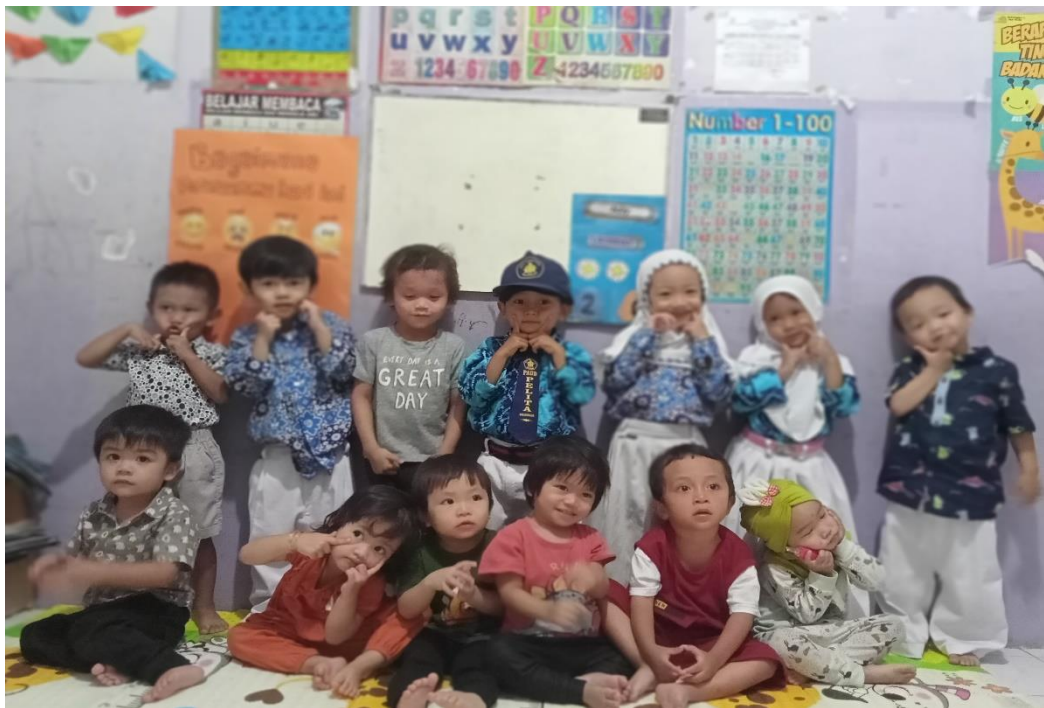
Anak-anak Kelompok Bermain