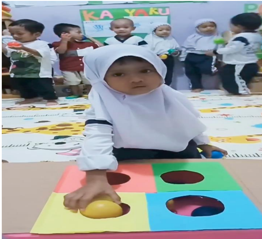
Kegiatan memasukkan bola ke dalam lubang sesuai warna