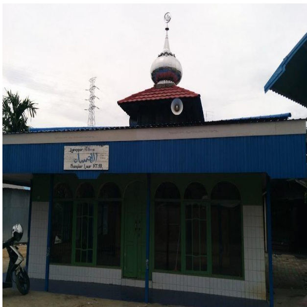
Gambar 4.1 Langgar Al Ikhsan cabang Komunitas Mengajian Si