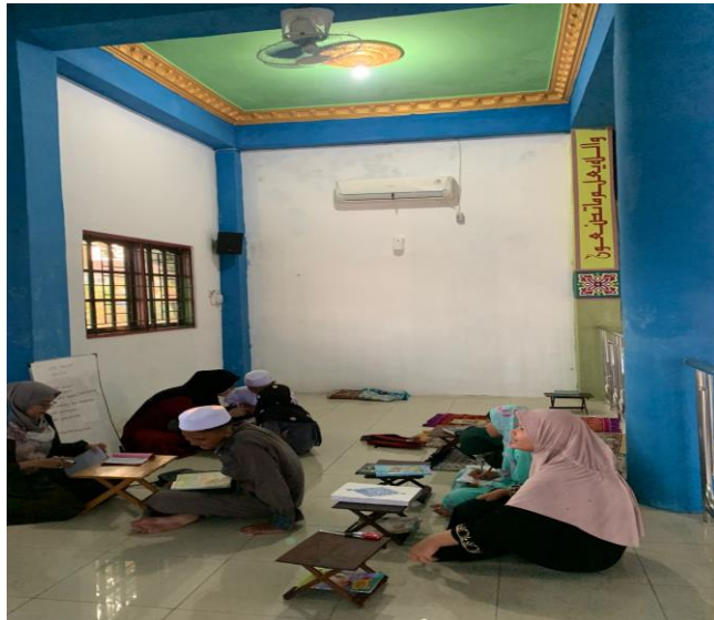
Gambar 4.6 Melakukan bimbingan kepada anak-anak di Komunitas Mengajian Si