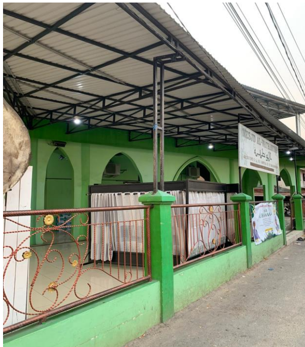
Gambar 4.2 Masjid Al- Wathaniyah cabang Komunitas Mengajian Si