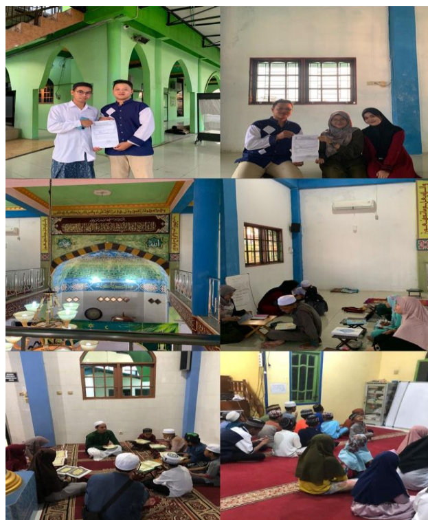
Gambar 4.5 dokumentasi pada saat riset

didukung oleh dokumentasi pada saat riset didapatkan data mengenai peran Komunitas Mengajian Si dalam pelaksanaan dakwah di Kota Banjarmasin sebagai berikut.