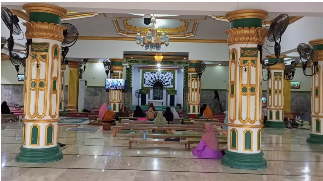
Foto Majelis Taklim Raudhatul Anwar Tampak dari dalam