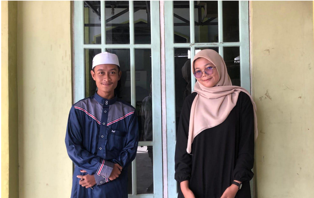
Wawancara bersama salah satu pengurus Majelis Taklim Raudhatul Anwar