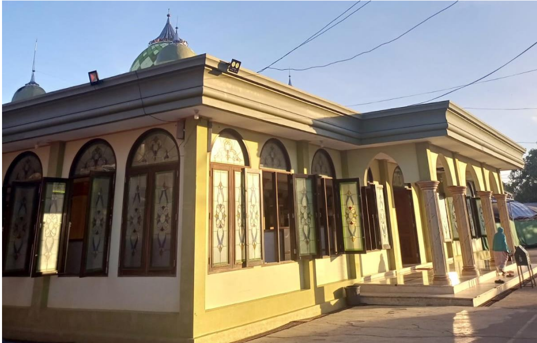
Foto Majelis Taklim Raudhatul Anwar tampak dari depan