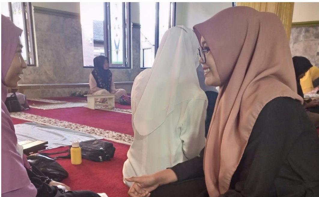
Wawancara bersama Jamaah Perempuan remaja