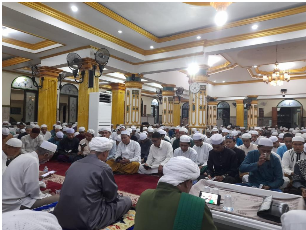
Foto Aktivitas Dakwah pembacaan Burdah khusus jamaah laki-laki