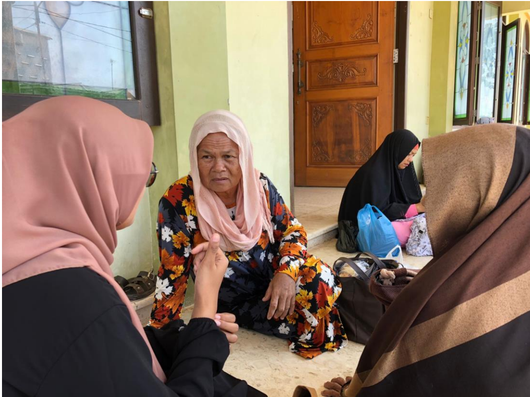
Foto bersama Jamaah Lansia