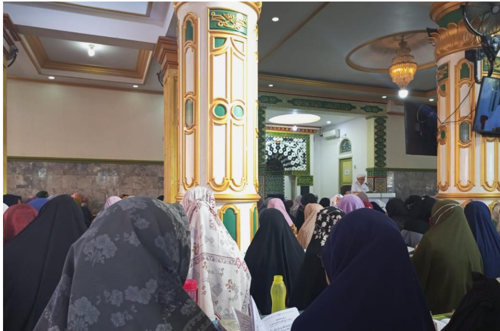
Foto Aktivitas Dakwah Pengajian Kitab khusus jamaah perempuan