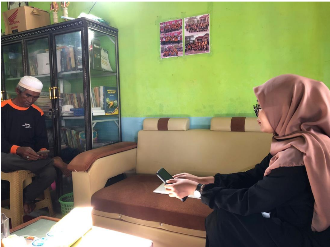
Wawancara bersama Aparat Desa