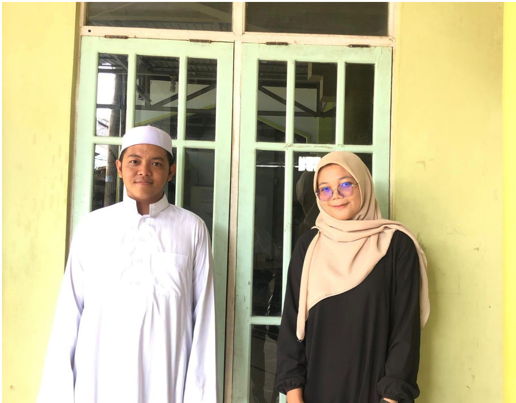
Wawancara bersama Jamaah Laki Laki