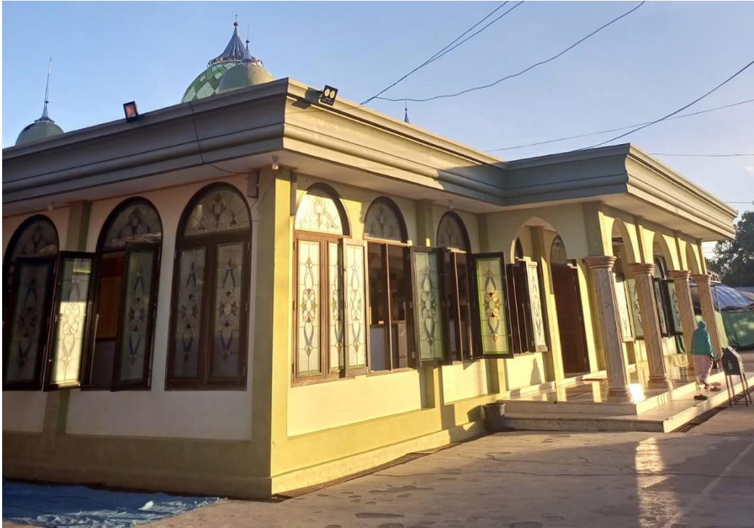
Gambar 4. 2 Majelis Taklim Raudhatul Anwar