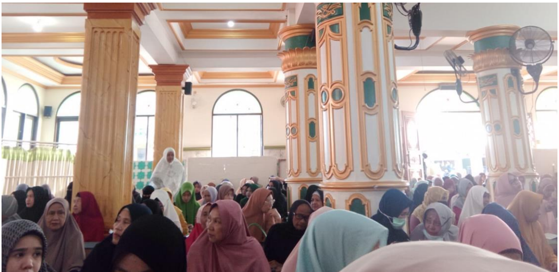
Gambar 4. 5 Jamaah saat kegiatan dakwah berlangsung

Awal mula tujuan didirikannya majelis ini adalah melanjutkan niat para ulama terdahulu, seperti Syekh Kasyful Anwar, dilanjutkan Syekh Ahmad Ghazali, dan amanah serta hasrat dari Syekh Anang Syaroni Arif agar murid yang berhadir dapat menambah pengetahuan dan pengamalan amal ibadah masyarakat, yang awal mulanya murid dimajelis ini 8 orang sampai sekarang sudah mencapai 200 bahkan lebih.