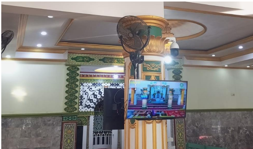
Gambar 4. 3 Sarana Prasarana Kipas Angin & Layar

Dengan adanya Layar yang sengaja dipasang di area belakang majelis hingga diluar majelis dan rumah KH. Munawwar Ghazali yaitu berupa televisi adalah untuk memudahkan jamaah melihat beliau selama majelis taklim berlangsung.