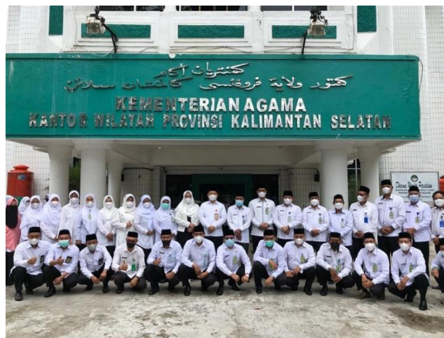
Gambar 4.1 Kantor Wilayah Kementerian Agama Provinsi Kalimantan Selatan