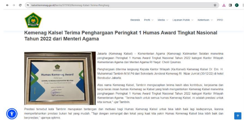
Gambar 4.6 Humas Kemenag Kalsel Terima Penghargaan

Humas kantor wilayah kementerian agama provinsi kalimantan selatan menerima penghargaan dalam acara Humas Award Tingkat Nasional Tahun 2022 sebagai juara 1 kategori Kantor Wilayah Kementerian Agama dari Menteri Agama RI Yaqut Cholil Qoumas, dalam hal ini berdasarkan wawancara kepada ketua tim humas kanwil kemenag kalsel bahwa beliau menjelaskan humas kanwil kemenag kalsel beberapa kali mendapatkan penghargaan dalam segi pengelolaan website terbaik dari tahun 2013 dan tahun 2022, kriteria penilaian yang digunakan ialah salah satunya publikasi berita satuan kerja teraktif. 94