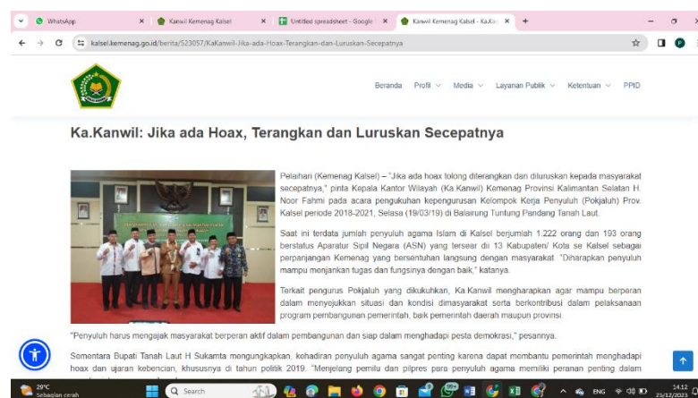
Gambar 4.5 Langkah Kemenag Tepis Hoax Dengan Menerangkan Dan Meluruskan

Kesimpulan dari hasil wawancara oleh beberapa narasumber dapat diambil kesimpulan yaitu selain memberikan membenaran atau karifikasi terhadap pemberitaan yang tidak benar akantetapi penting memberikan edukasi terhadap masyarakat. Seperti yang di sampaikan oleh Inspektur Jenderal Kementerian Agama (Kemenag) RI H. M. Nur Kholis Setiawan pada tahun 2018 menawarkan tiga konsep penanggulangan hoax “Konsepnya ialah Saring, Sebelum, Share” 89