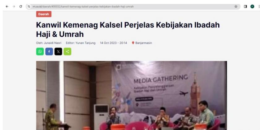
Gambar 4.4 Media Gathering yang digelar Kanwil Kemenag Kassel dipublikasikan oleh RRI

Dengan demikian, strategi kerjasama media harus disesuaikan dengan sifat berita dan audiens target. Penggunaan media lokal, nasional, atau pusat akan tergantung pada konteks dan ruang lingkup berita yang ingin disampaikan.