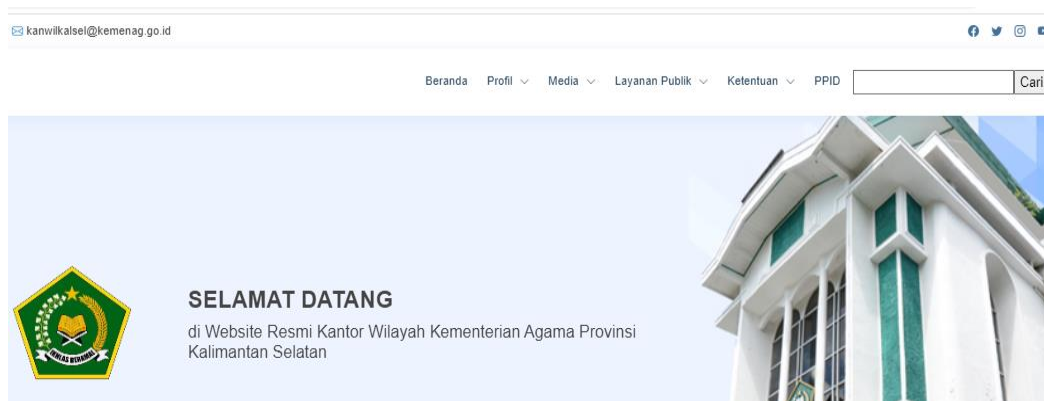
Gambar 4.3 Halaman Web Dan Media Kemenag Kalsel