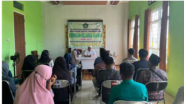
Bimbingan Pra Nikah di KUA Banjarmasin Timur