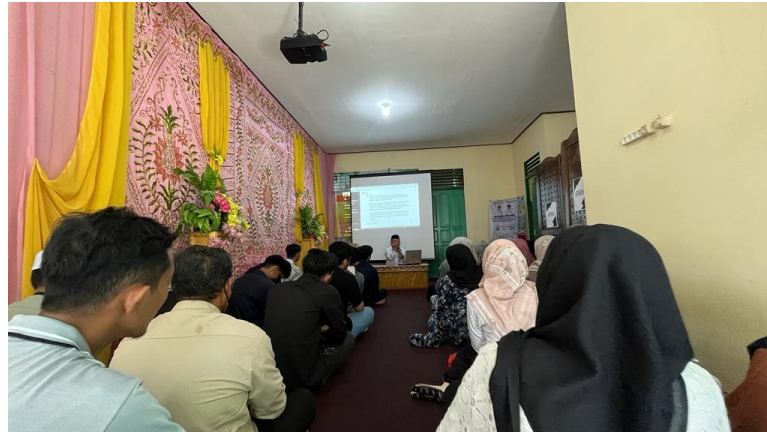
Bimbingan Pra Nikah di KUA Banjarmasin Utara