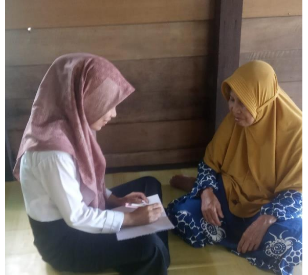
Informan 2 (H)