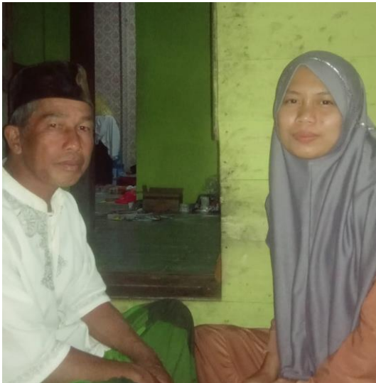
Informan 1 (MS)