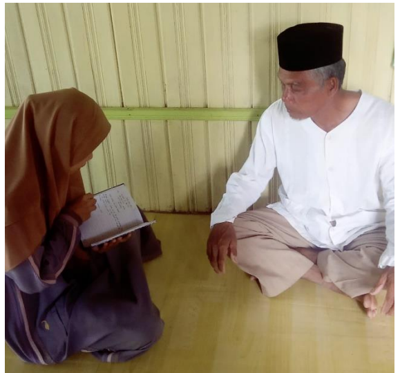
Informan 2 (W)