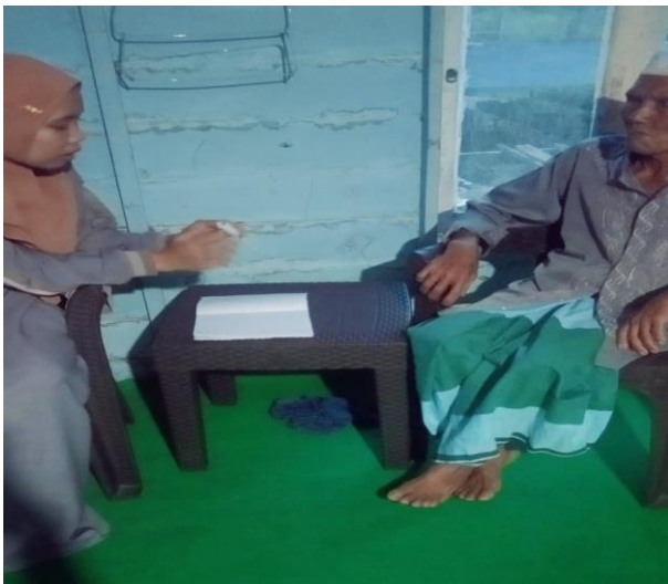
Informan 3 (M)