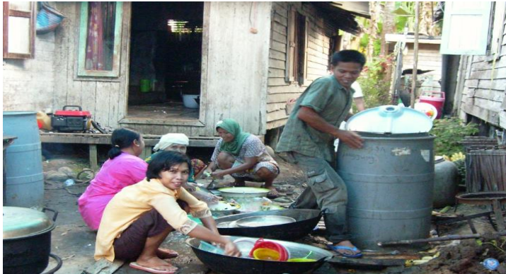
Gambar 1: Kegiatan Sosial Masyarakat Umat Bergama Dalam Acara Perkawinan : Tabuan