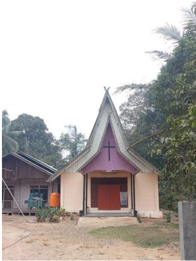
Gambar 14: Gereja Katolik Santo Mikael : Gunung Riyut