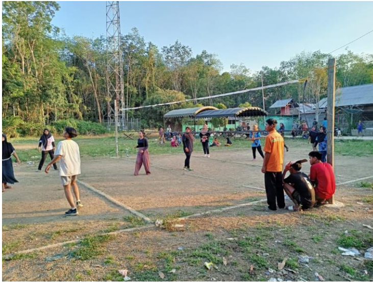
Gambar 3: Kegiatan Lomba 17 Agustus Yang Dimeriahkan Oleh Berbagai Agama: Mantuyan