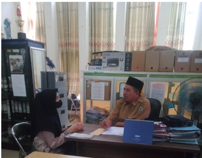
Gambar 10: Wawancara Dengan Staf Kantor Kecamatan Halong