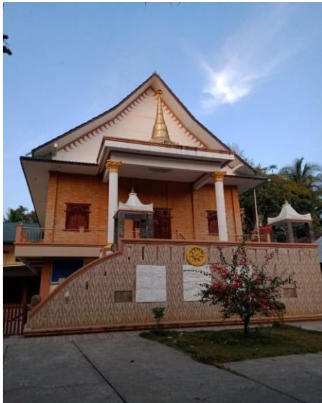
Gambar 13: Vihara Budhatama: Tabuan