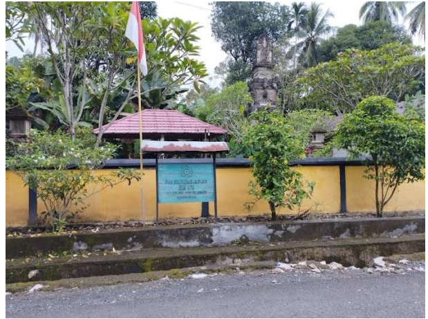
Gambar 14 : Pura Jagatnata Bajalin Jaya: Liyu