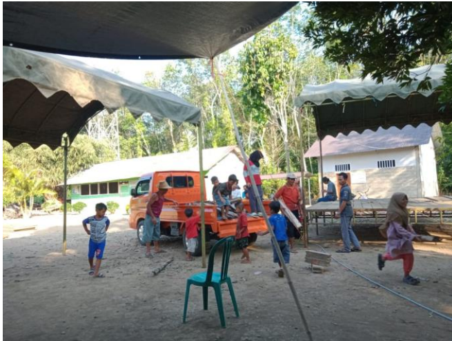
Gambar 5: Kegiatan Masyarakat Untuk Penggalangan Dana (Saprah Amal): Mantuyan