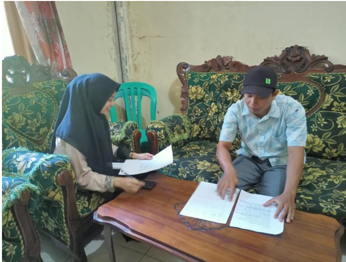
Gambar 7: Wawancara Dengan Aparat Desa Gunung Riyut