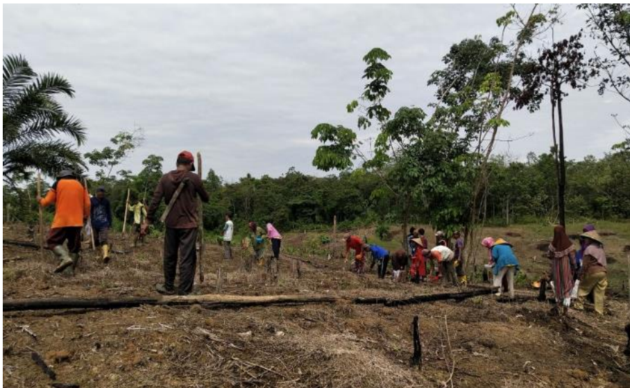
Gambar 2: Kegiatan Sosial Masyarakat Dalam Tradisi Manugal: Mantuyan