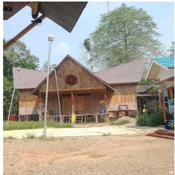
Gambar 12: Balai Adat: Liyu