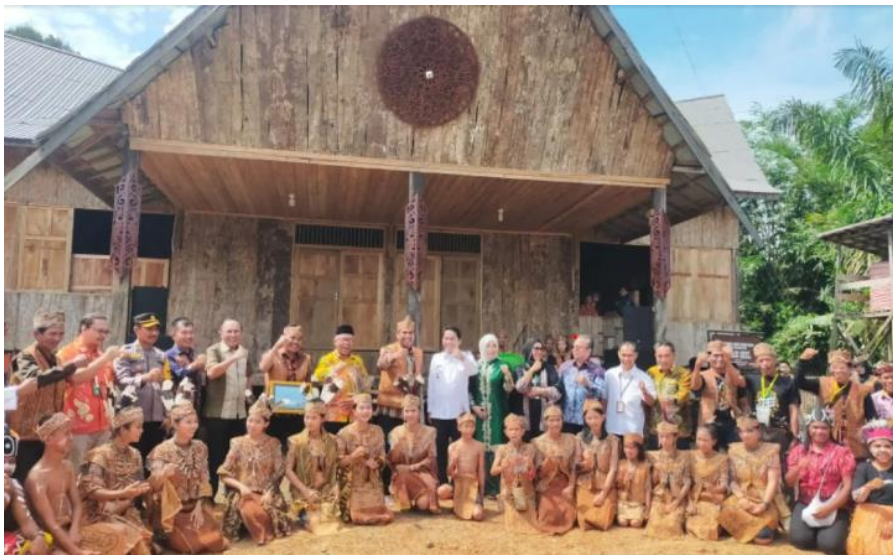
Gambar 4: Kegiatan Festival Budaya Mesiwah Pare Gumboh: Liyu