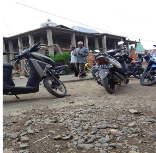
Gambar 16 : Masjid Nurul Huda: Tabuan