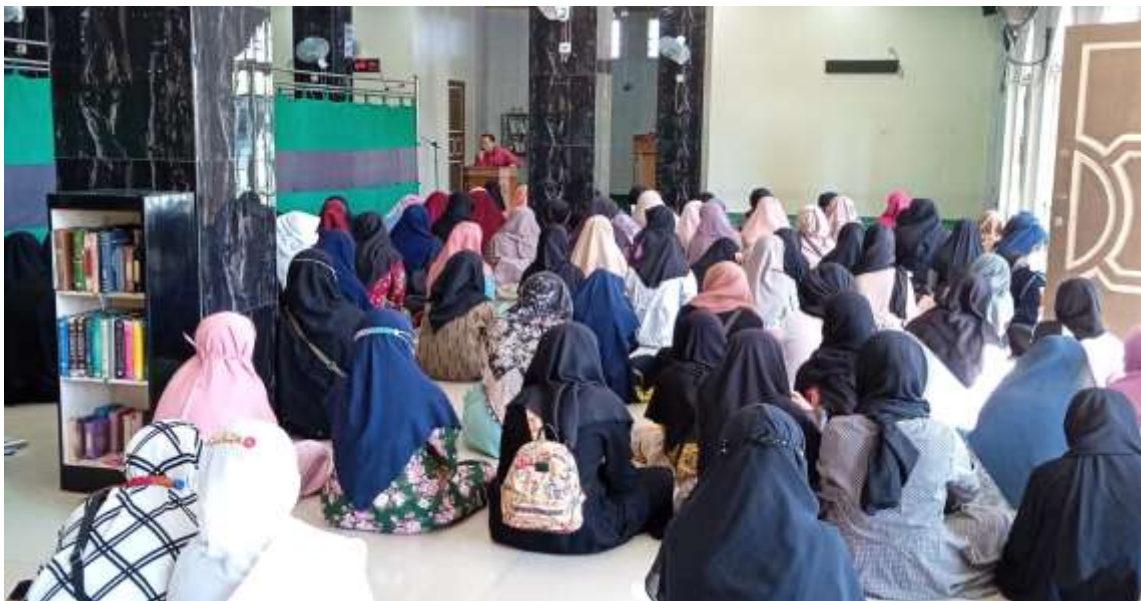
Foto kegiatan bimbingan keagamaan di bagian para santriwati n