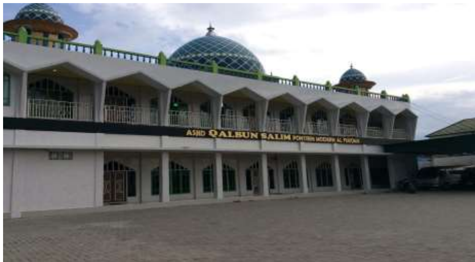
Foto Masjid Qalbun Salim