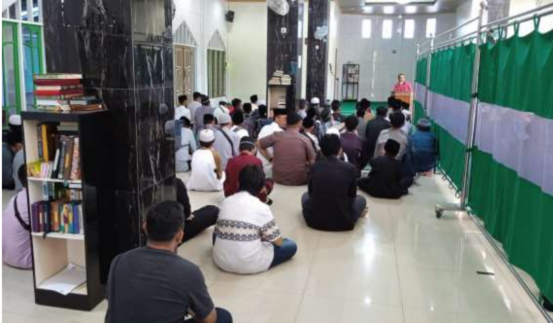
Foto kegiatan bimbingan keagamaan di bagian para santri nya