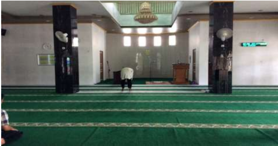
Didalam Masjid Qalbu Salim