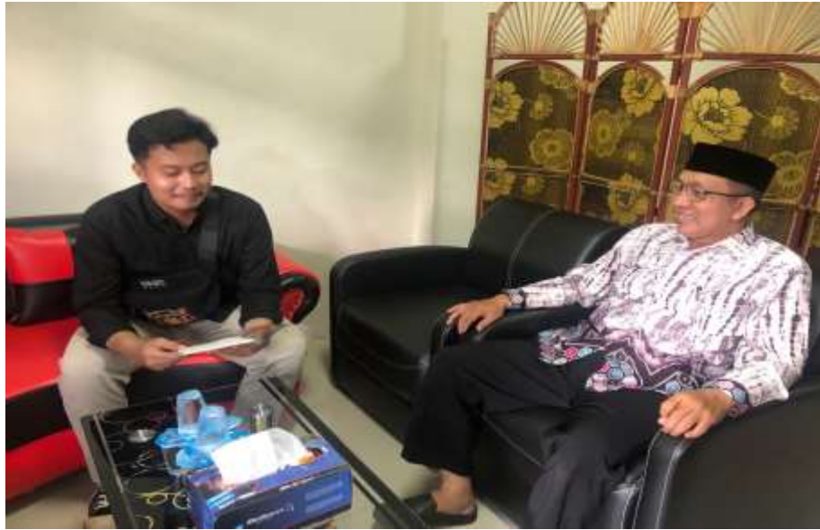
Foto wawancara dengan kepala madrasah aliyah Al-Furqon Banjarmasin