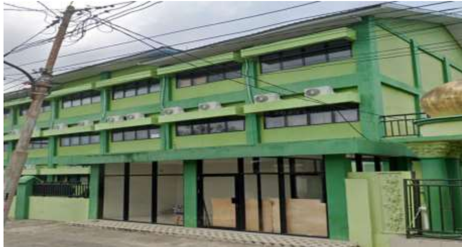
Foto MA Muhammadiyah 2 Ponpes Modern Al-Furqon Banjarmasin