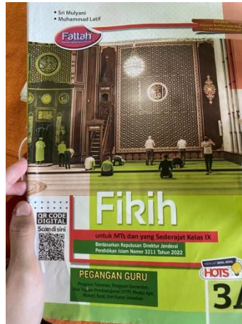
Gambar 4.6 Bahan ajar berupa buku pegangan guru

Selanjutnya, Bapak Najahiman berkata bahwa: