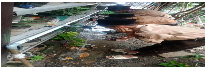
Gambar 4.8 siswa berwudhu untuk melaksanakan shalat dzuhur berjamaah

“Inovasi yang diterapkan guru fiqih ini tentu berdampak baik untuk siswa karena siswa dapat melihat dan mempraktekan materi ibadah secara langsung, sehingga siswa dapat memahami materi dengan baik. Selain itu, dampak ini juga dapat meningkatkan interaktif guru dalam proses pengajaran” 14