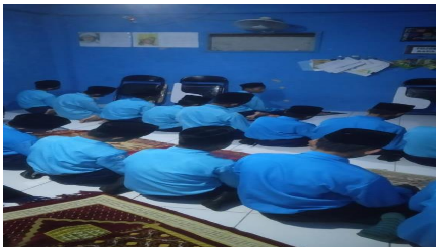
Gambar 4.9 Siswa mengimami pelaksanaan shalat dzuhur berjamaah di MTs Nur Rahman Martapura

Adapun wawancara dengan guru Qur'an hadis, menyatakan: