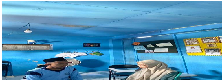
Gambar 4.3 Wawancara dengan siswa bernama Aiman mengenai inovasi guru fiqih dan dampak yang dia rasakan dari inovasi tersebut

“Bapak menyampaikan materi pelajaran dengan baik, kami sering belajar sambil bermain jadi saya tidak bosan” 3