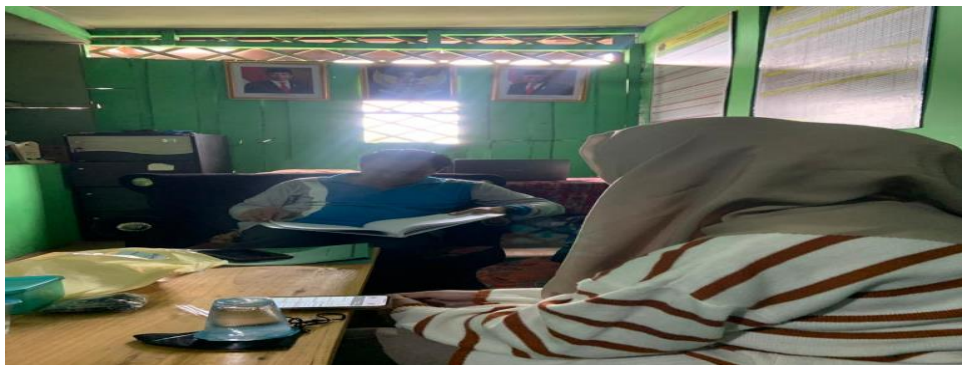
Gambar 4.2 Wawancara dengan Bapak Najahiman mengenai bentuk inovasi yang diterapkan dan dampak dari inovasi yang telah diterapkan

“Sebelum melibatkan siswa dalam praktik langsung, saya mencontohkan terlebih dahulu di dalam kelas mengenai tata cara shalat yang benar saat pembelajaran mengenai shalat.” 2