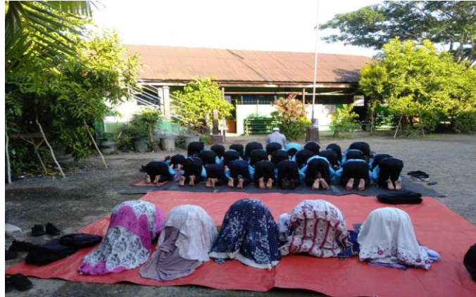
Gambar 4.4 Guru mengimami pelaksanaan shalat dhuha di lapangan MTs Nur Rahman Martapura