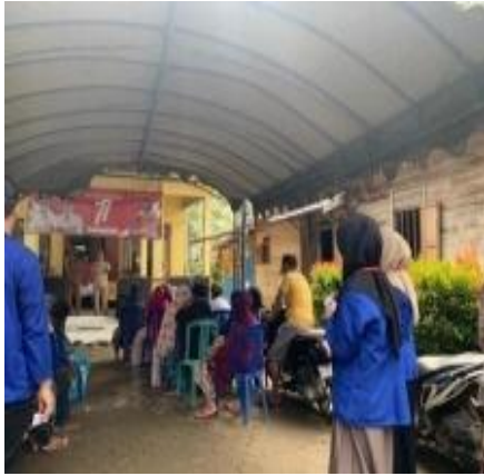
Sosialisasi kepada masyarakat