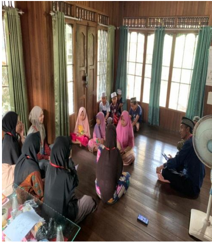
Sosialisasi kepada anak-anak