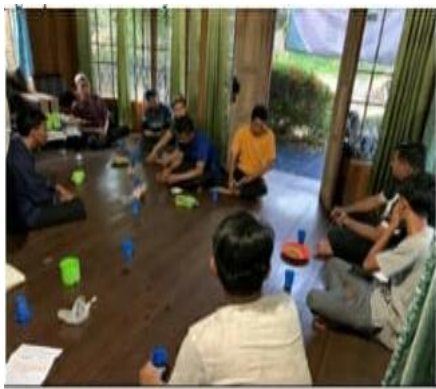
Sosialisasi kepada Karang taruna