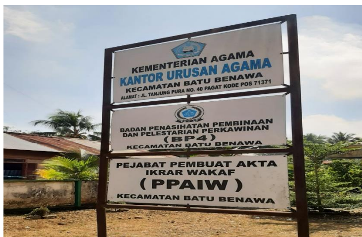
Gambar 4.2 Kantor Urusan Agama, Kecamatan Batu Benawa

Adapun lokasi penelitian ialah Kantor Urusan Agama (KUA) Desa Pagat kecamatan Batu Benawa sebagai berikut. 80