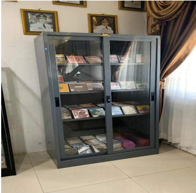
Gambar 4.2 Penyimpanan Koleksi deposit digital diruang Deposit