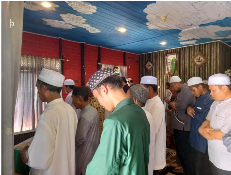
GAMBAR 4.10 Sholat Jenazah