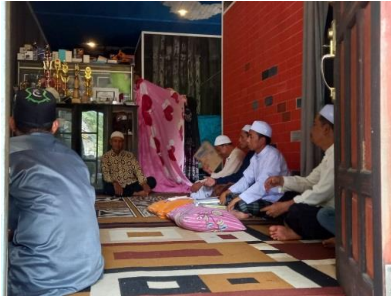
GAMBAR 4.9 Pembacaan Tahlil

memandikan dan mengkafani jenazahnya. Setelah tahlil selesai dan jenazah sudah dimandikan serta dikafani, barulah jenazah dishalatkan.