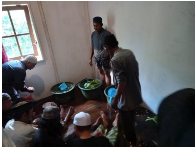
GAMBAR 4.8 Persiapan Memandikan Jenazah