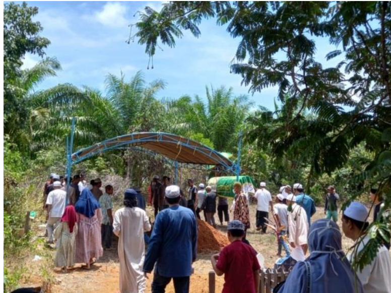
GAMBAR 4.11 Menguburkan Jenazah

Proses implementasi dakwah bil hal dalam organisasi rukun kematian ini menjadi hak bagi setiap anggota rukun kematian. Sedangkan bagi jenazah sendiri, peran rukun kematian tidak muncul sama sekali. Karena anggota atau keluarga anggota akan menghubungi pihak rukun kematian ketika seseorang telah dipastikan meninggal dunia. Sehingga tidak ada pendampingan dari pihak rukun kematian dalam sakaratul maut.