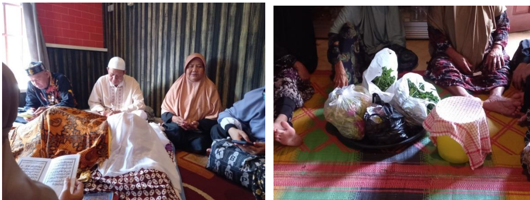
GAMBAR 4.7 Takziah

Berdasarkan hasil wawancara yang penulis lakukan di atas dapat disimpulkan bahwa masyarakat di Desa Asam-asam ketika bertakziah, mereka datang membacakan surah yasin dan membawa beras untuk keluarga yang ditinggalkan, hal itu sudah menjadi kebiasaan di lingkungan masyarakat setempat untuk membantu keluarga yang ditinggalkan dalam menyiapkan keperluan untuk acara tahlilan.