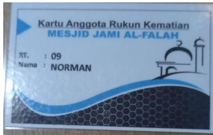
GAMBAR 4.6 Sarana Pengurusan Jenazah Rukun Kematian Al-Falah

Untuk sarana atau perlengkapan pengurusan jenazah ini kami sediakan semua, ambulan juga kami sediakan, dan ambulan ini siapa aja yang perlu boleh memakai, misal dari RT lain mau minjam saja. Kami juga punya kartu anggota, jadi lebih memudahkan anggota kalau ada yang meninggal langsung menghubungi nomer telpon yang ada di kartu anggota. 5