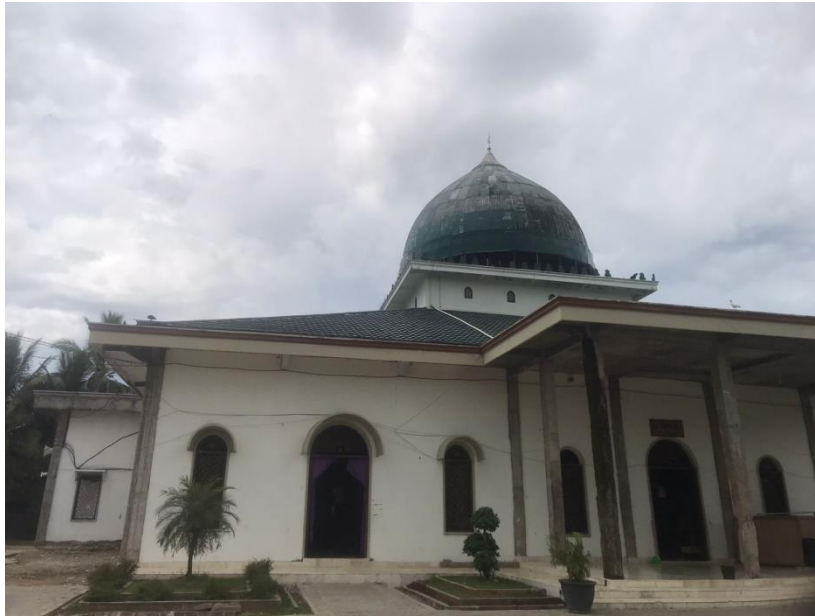
Bangunan sekarang yang digunakan untuk pengajian Majelis Taklim Anwarul Hasaniyah