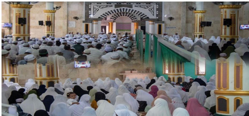
Foto pengajian Majelis Taklim hari senin