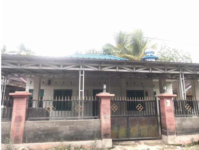
Tempat kedua pelaksanaan pengajian di Majelis Taklim