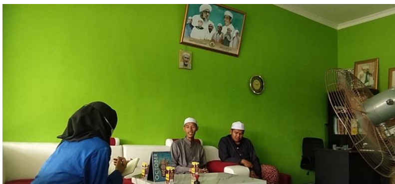
Foto wawancara dengan pengurus Majelis Taklim