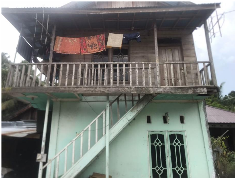
Tempat pertama membuka Majelis Taklim