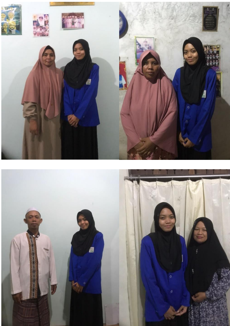
Foto wawancara dengan para jemaah Majleis Taklim