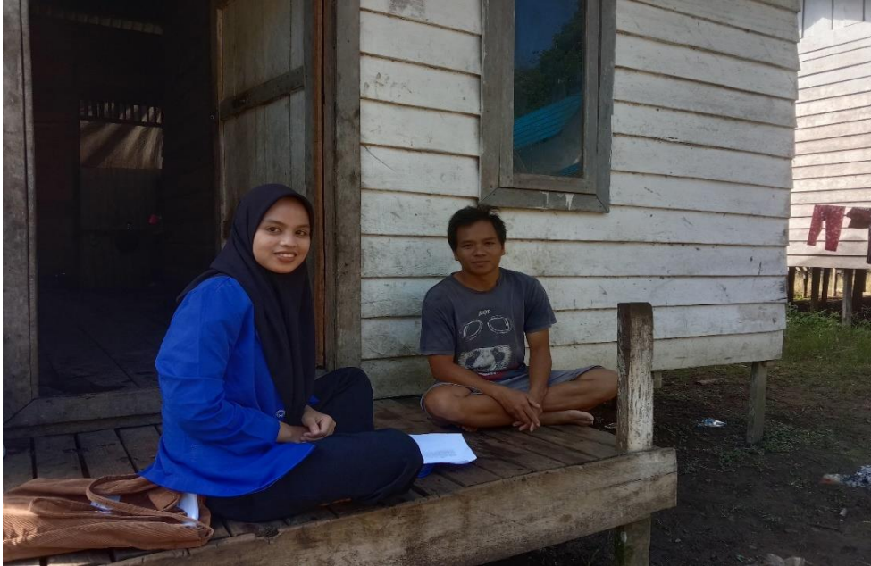
Lampiran 1 Peneliti Melakukan Wawancara Bersama Warga Kampung Kiyu