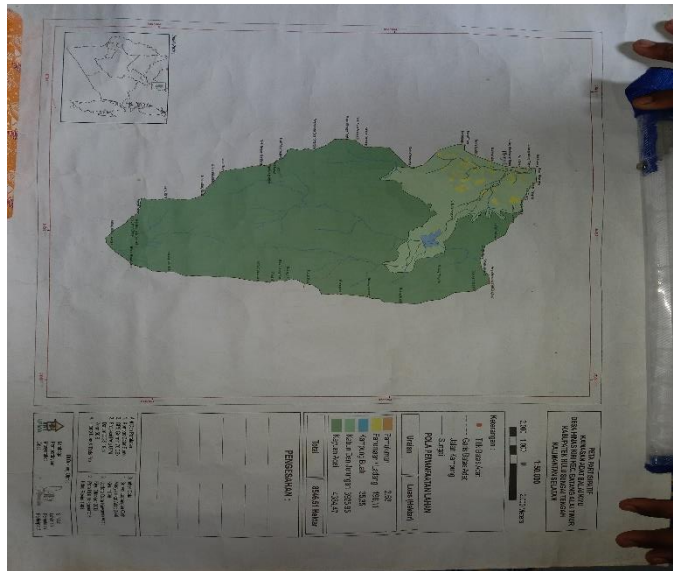
Peta Daerah Kampung Kiyu

sekitar mungkin memberikan teduh dan suasana yang nyaman di persimpangan ini, menjadi titik awal bagi berbagai perjalanan ke berbagai destinasi yang terkait dengan kehidupan sehari-hari dan eksplorasi alam.