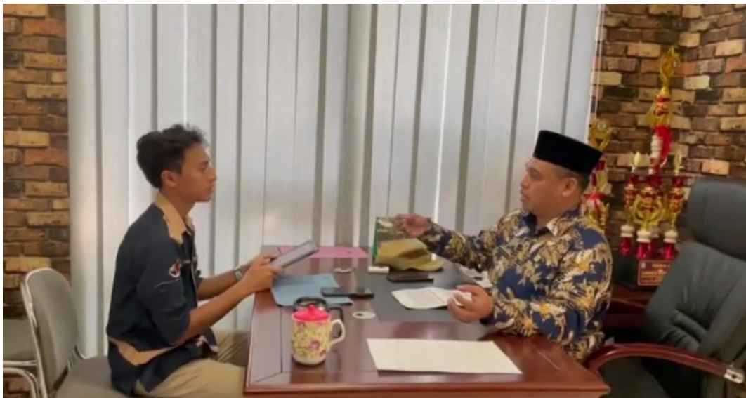
Wawancara bersama Kepala Kecamatan Bekasi Selatan bapak