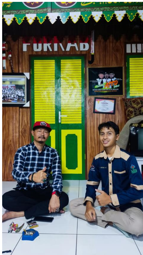
Wawancara bersama Ketua FORKABI (Forum Komunikasi Anak Betawi)