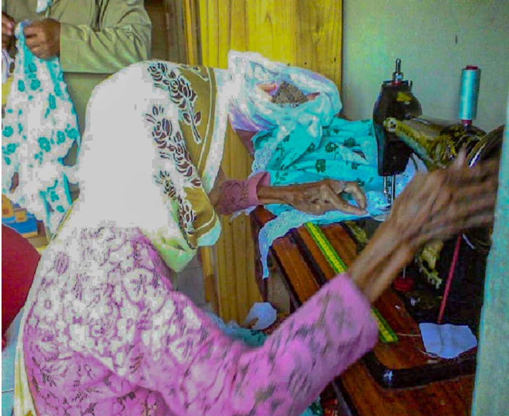
Gambar 4. 12. keterampilan menjahit lansia PPRSLU Budi Sejahtera di kota Banjarbaru.