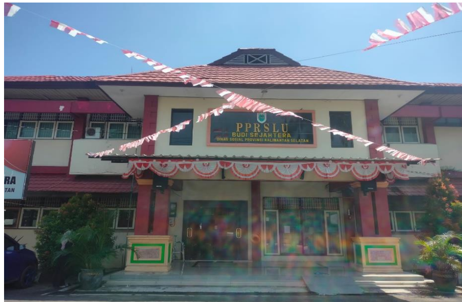
Gambar 4. 1. Gedung Kantor Panti Perlindungan dan Rehabilitasi Sosial Lanjut Usia Budi Sejahtera