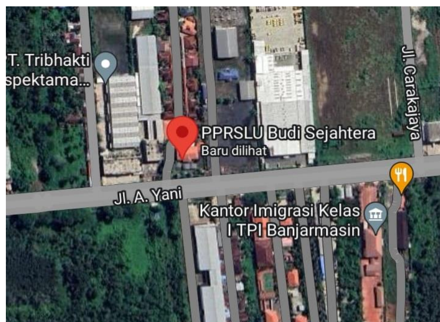
Gambar 4. 2. Lokasi Maps Panti Perlindungan dan Rehabilitasi Sosial Lanjut Usia Budi Sejahtera kota Banjarbaru