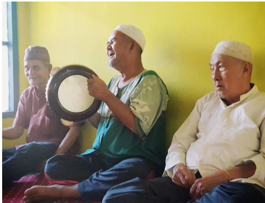
Gambar 4. 6. Kegiatan Maulid Al-Habsy di Panti Perlindungan dan Rehabilitasi Sosial Lanjut Usia Budi Sejahtera kota Banjarbaru

Habsyi berisi senandung atau syair- syair Islami yang biasanya bermakna puji pujian kepada Nabi Muhammad SAW (shalawat) dengan menggunakan instrument rebana, biasanya pembacaannya diawali dengan pembacaan ayat suci Al- Qur'an dan doa serta shalawat kepada Nabi SAW yang dipimpin oleh bapak Fahnor Rahman S.Ag, kegiatan ini bertujuan untuk meningkatkan keimanan dan ketakwaan para lansia kepada Allah SWT.