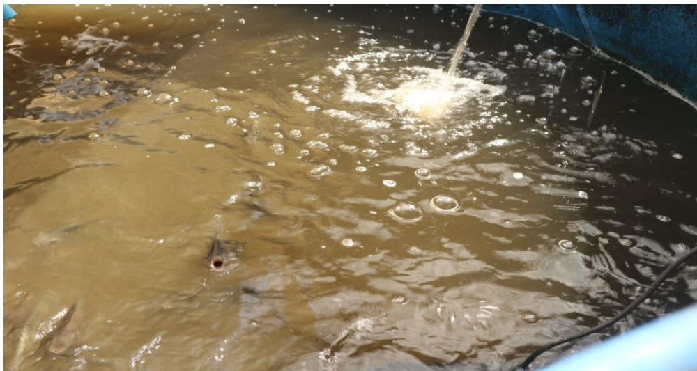
Gambar 4. 11. Budidaya ikan nila