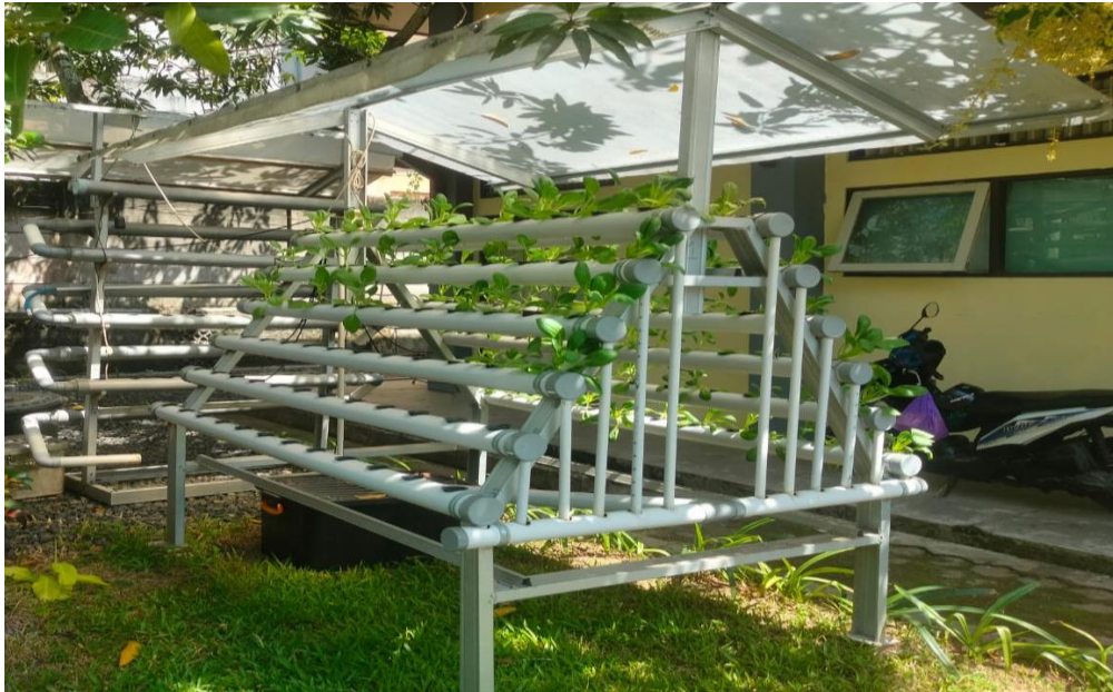
Gambar 4. 10. Tanaman hidroponik yang dibuat oleh para lansia