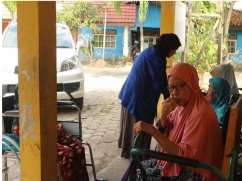
Gambar 4.8. Jemaah Lansia yang menggunakan kursi roda menghadiri ceramah agama