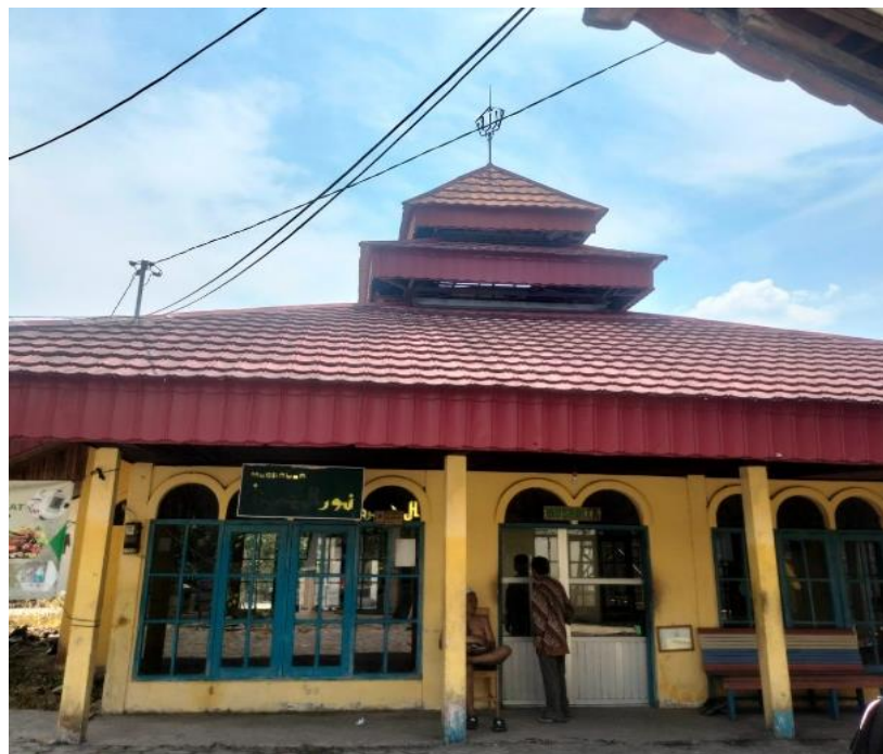
Gambar 4. 9. Mushola Nurul Hasanah Panti Perlindungan dan Rehabilitasi Sosial Lanjut Usia Budi Sejahtera Kota Banjarbaru