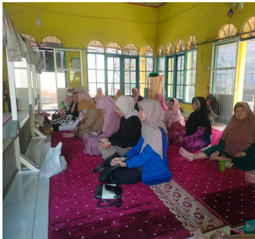
Gambar 4.7. Jemaah Ceramah Agama