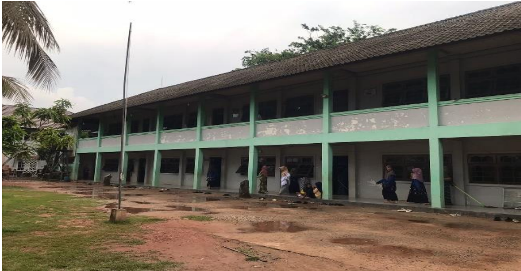
Gambar 4. 1 Pondok Pesantren Manba'ul 'Ulum Puteri

Data bersumber dari: Dokumentasi peneliti pada Kamis, 16 November 2023