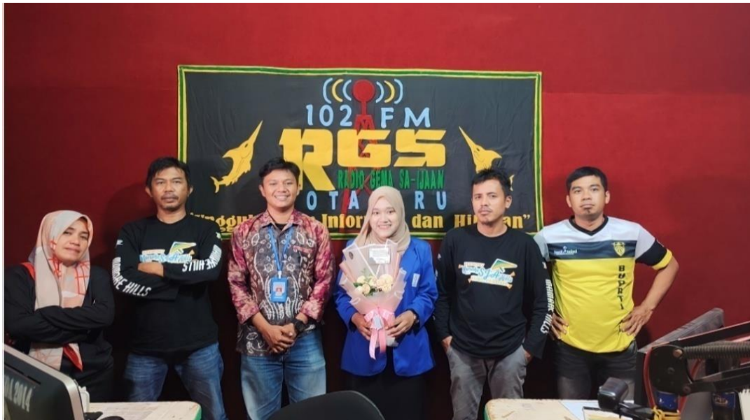
Gambar 4.2 Foto bersama di Radio Gema Saijaan Kabupaten Kotabaru