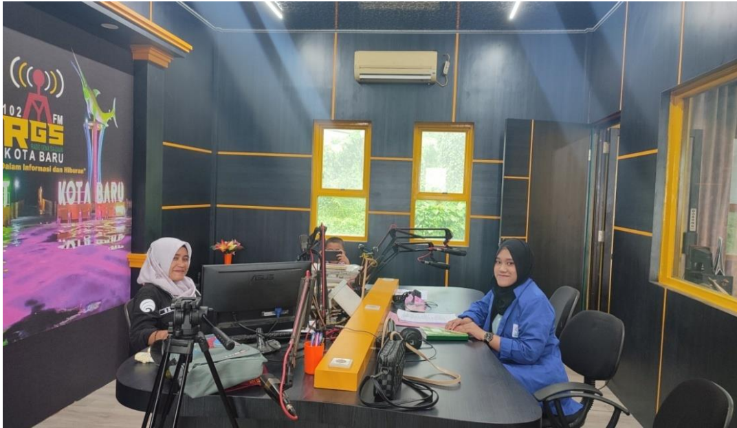
Gambar 4.10 Studio Penyiaran Radio Gema Saijaan