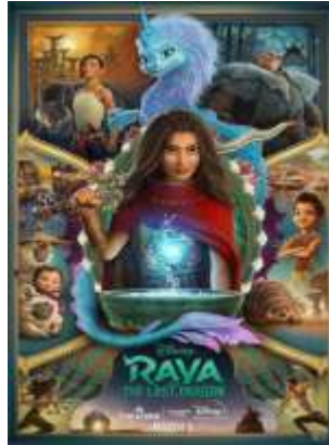
Gambar 1.2 Poster Film Raya

Boun. Sedangkan Kelly Marie Tran sebagai Raya dan Alan Tudyk sebagai Tuk Tuk.