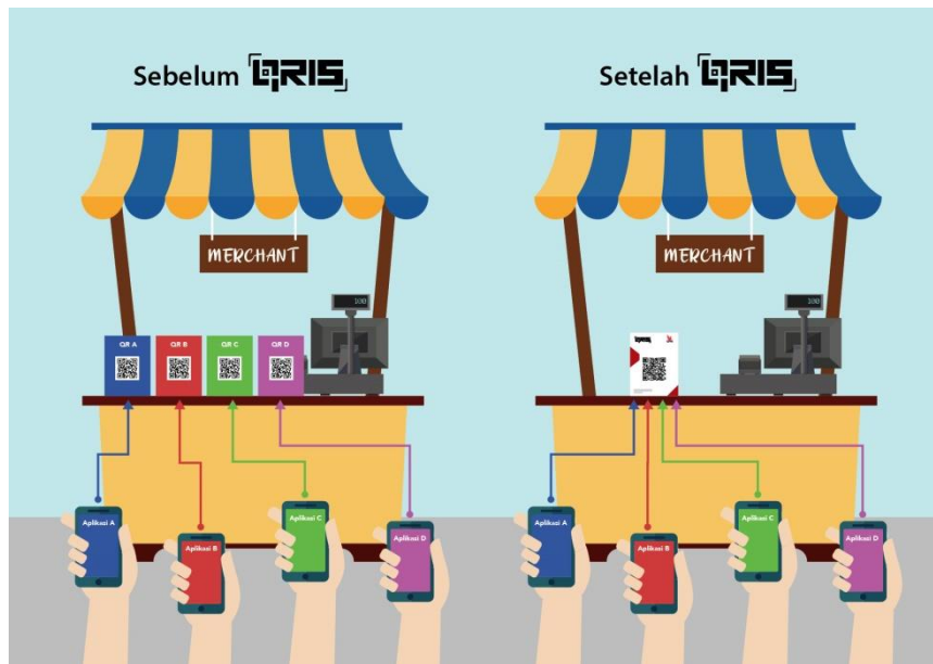
Gambar 1.1 sebelum dan setelah adanya QRIS

QRIS dikembangkan oleh industri sistem pembayaran bersama dengan Bank Indonesia agar proses transaksi dengan QR Code dapat lebih mudah, cepat, dan terjaga keamanannya. Semua Penyelenggara Jasa Sistem Pembayaran yang akan menggunakan QR Code Pembayaran wajib menerapkan QRIS. Saat ini, dengan QRIS, seluruh aplikasi pembayaran dari Penyelenggara manapun baik bank dan nonbank yang digunakan masyarakat, dapat digunakan di seluruh toko, pedagang, warung, parkir, tiket wisata, donasi ( merchant ) berlogo QRIS, meskipun penyedia QRIS di merchant berbeda dengan penyedia aplikasi yang digunakan masyarakat ( https://www.bi.go.id/QRIS/Default.aspx , n.d.).