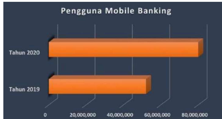
Gambar 1. 1 Pengguna Mobile Banking 2019-2020