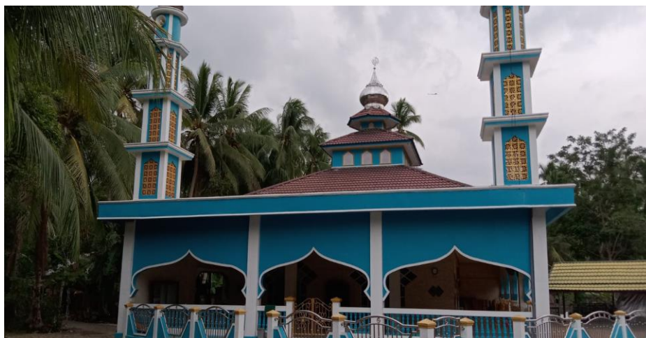
Gambar 4. 2 Mesjid Nurul Ihsan

Sarana peribatan yang berada di desa ini seperti langgar/surau/mesjid empat buah yaitu satu masjid dan 3 buah langgar, bagi masyarakat yang ingin melaksanakan ibadah salat Jum'at tidak harus pergi ke desa lain sebab sudah ada mesjid di desa ini yaitu Mesjid Nurul Ihsan.