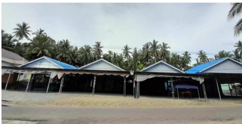
Gambar 4. 3 Majelis Ta'lim Al-Mubarakah